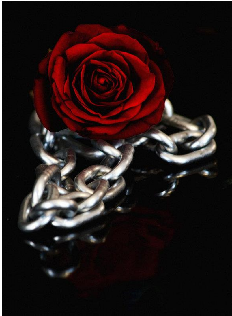
Figura 1. Chained Dark Red Rose [Rosa Rojo Oscuro Encadenada]. Por: Lynne, Robin (2010)