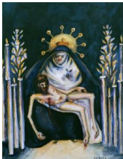
Imagen 2. Autora: Débora Arango. Años 40 La Dolorosa Acuarela (56 x 39) cms. Colección MAMM