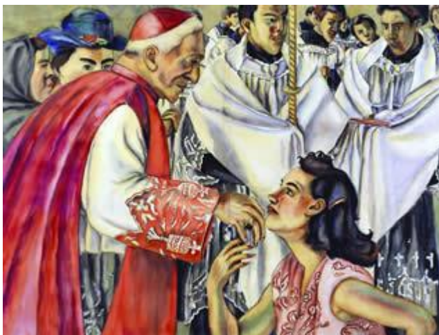
Imagen 6. Indulgencias, El Obispo o La Procesión (1941) Acuarela. Colección Museo de Antioquia

Se hace pertinente traer a colación el referente anecdótico de la misma. La anécdota que le dio vida al motivo de la obra se refiere a una situación de la que la artista fue testigo en una procesión de Corpus Christi en Medellín: una vendedora, que en la pintura se ve vestida llamativamente, con brazos descubiertos y las uñas largas, pintadas de rojo, se escurrió entre la gente para acercarse al arzobispo, cual "pecadora arrepentida" —en palabras de la artista Débora Arango—, que se arrodilla y besa el solemne anillo del arzobispo. El suceso también lo presenciaron los monaguillos, quienes en la pintura expresan una condición actitudinal de sanción social, al igual que las mujeres pudorosas y recatadas vestidas que aparecen detrás de la figura del obispo.