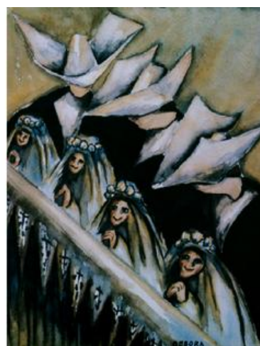
Imagen 5. Autora: Débora Arango. La Primera Comunción Acuarela (29 x 23) cms. Colección MAMM

La imagen 4, la obra Las monjas y el cardenal , y la imagen 5 Primera comunión nombres que implican en la mujer un reparto de su rol en el que normalmente siempre se juega y asume en sus vidas como principio fundamental y fin último al hombre, a lo masculino, ellas, las mujeres, las monjas, las niñas, viven por y para él, el cardenal, el Dios, el padre, el hijo, el espíritu santo, que en últimas es la representación del mismo hombre, y dado por convencionalismos de época se asignan otros nombres.