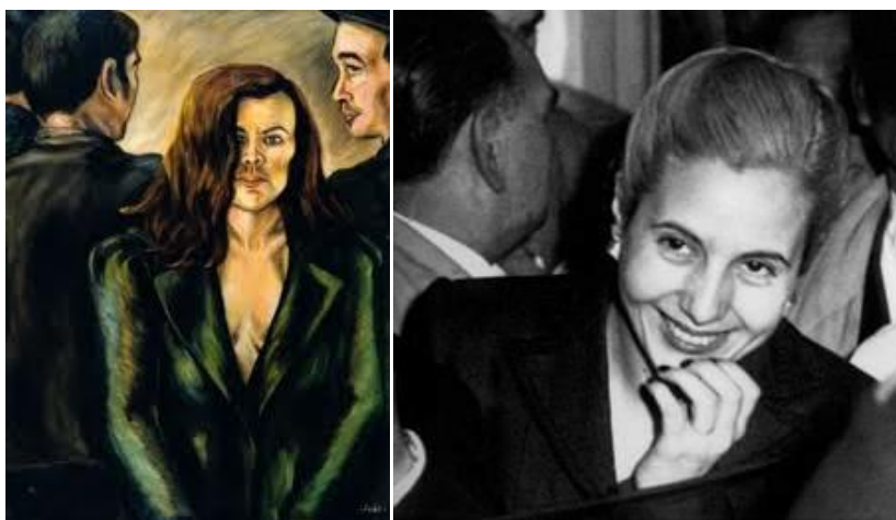
Imagen 12. Autora: Débora Arango. Imagen 13. El Retorno Óleo sobre lienzo (96 x 70) cms. Colección MAMM Eva Perón (1947)

La mujer argentina ha superado el período de las tutorías civiles. La mujer debe afirmar su acción, la mujer debe votar. La mujer, resorte moral de su hogar, debe ocupar el sitio en el complejo engranaje social del pueblo. Lo pide una necesidad nueva de organizarse en grupos más extendidos y remozados. Lo exige, en suma, la transformación del concepto de mujer, que ha ido aumentando sacrificadamente el número de sus deberes sin pedir el mínimo de sus derechos. (Eva Perón, 1946, discurso sobre el sufragio femenino, Documental Homenaje a Eva Perón, 2010).