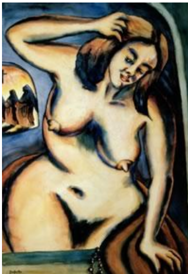
Imagen 21. Autora: Débora Arango La Huida Del Convento . (1944) Acuarela (100 x 67) cms. Colección MAMM.

En la imagen 21 se ve de fondo un crucifijo, y unas sombras, que bien pueden ser monjas, en un plano medio una mujer desnuda, como liberándose de todo lo que se ve en el fondo del cuadro, es decir, de todos los tabú, tapujos, límites que encierran a la mujer en la modernidad. Al lado de la mano derecha, enseguida del chal café, un rosario, del que esta mujer se ha deshecho para disfrutar de sí misma. Se observa en esta obra una mujer que no tiene miedo, ni se resiste al cambio, cambio que por supuesto Arango impulsa desde lo pictórico en nuestro país, marcando una pauta no solo a nivel nacional, sino también en otras partes del mundo.