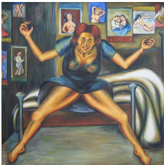
Imagen 1. Autora: Débora Arango. Esquizofrenia en la cárcel . Década del 40 Óleo sobre Lienzo (162 x 165) cms. Colección MAMM

Referencia en la que se puede deducir lo que se viene planteando hasta el momento, pues la mujer que está en primer plano conceptualiza las pinturas que se ven en el fondo de la obra, siendo ella el objeto detonante de una mujer que lucha por escapar de una cama, de una cárcel, de un esquema, pero que aún así no lo logra. Las representaciones que se encuentran en los cuadros de fondo, dentro del cuadro mismo, develan en esta mujer su necesidad de libertad, de querer ser.