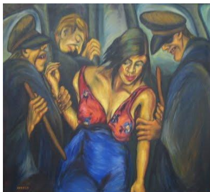
Imagen 20. Autora: Débora Arango Justicia . (1944) Óleo sobre lienzo (109 x 121) cms Colección MAMM

En la Imagen 20 se aprecia a una mujer maquillada, descubierta en su atuendo, y descubierta por este grupo de hombres, policías, juristas, normalizadores, que la cogen inhibiéndole y limitando su libertad, su esencia. Se observan igualmente los bolillos de los varones, que bien pueden representar el arma con la que corregirán a dicha mujer y que en el falocentrismo bien podrían representar el falo, el poder, con el que se puede dar una ley, corregir, normalizar e incluir a esta mujer de justicia.