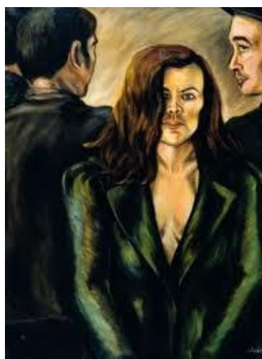
Imagen 9. Autora: Débora Arango. El Retorno Óleo sobre lienzo (96 x 70) cms. Colección MAMM

La entrada laboral de la mujer en el mundo social altera todas las dimensiones de la vida familiar. Débora Arango lo registra en su obra con el siguiente cuadro: