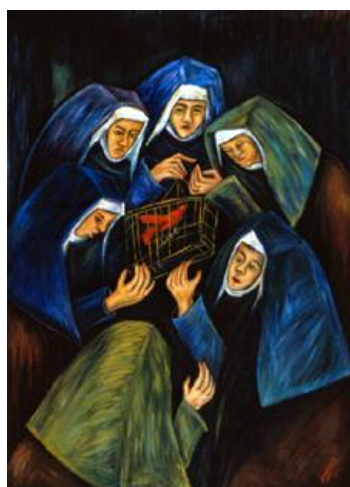
Imagen 4. Autora: Débora Arango. Década del 70 Las Monjas y El Cardenal y/o El Recreo Óleo sobre lienzo (178 x 127) cms. Colección MAMM

Por eso es frecuente ver que la educación de las mujeres modernas se direccionaba siempre hacia el varón o la figura masculina como se observa en estas dos obras pictóricas de Débora Arango: