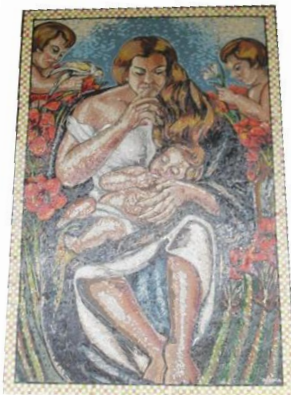
Imagen 16. Autora: Débora Arango La madona del silencio . Década del 40 Óleo sobre lienzo (136 x 92) cms. Colección MAMM

Evita no solamente es mujer, esposa, sino también símbolo de maternidad. Ella en sí misma representa socialmente varias categorías de la mujer configurando una imagen que se puede ver y analizar desde varias perspectivas, no solo en lo femenino, sino también en lo humano.