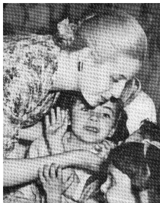
Imagen 17. Fotografía Creación de la fundación Eva Perón (1948)

Ejemplo claro de ello es la imagen 17 donde se ve a Evita con niños desprotegidos, en la inauguración de su fundación. Tanto la imagen 16 como