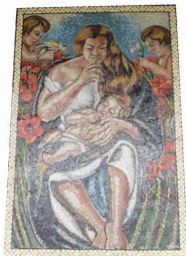
Imagen 7. Autora: Débora Arango. La Madona Del Silencio Óleo sobre lienzo (136 x 92) cms. Colección MAMM