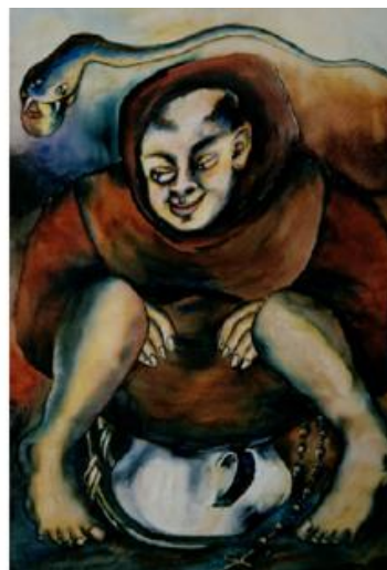
Imagen 3. Autora: Débora Arango. Años 30-40 Levitación Acuarela (97 x 67) cms. Colección MAMM

Del lado izquierdo, la imagen 2, la madre, la madre de Jesús, que bien representa la condición de lo que debe ser una mujer como madre. Del lado derecho, la imagen 3, la serpiente con la manzana, tentando a este monje que no es más que un pobre mortal, es decir, un hombre con debilidades carnales; bien podría decirse que la manzana y la serpiente en unísono representan a la mujer en sí misma, en sí misma porque es el modo que la mitología judeo-cristiana se ha encargado de registrar.