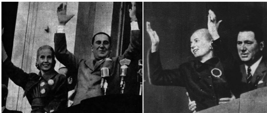
Imagen 14. Eva Perón y Domingo Perón (1949) Imagen 15. Domingo Perón y Eva Perón Último Discurso (1951)

Se traen como referentes estas dos imágenes, en la imagen 14 se ve a la mujer que acompaña a su marido, éste fue el principio de Eva Perón, ella ayudando a su esposo. En la imagen 15, Eva Perón es reclamada por la masa, como alma del peronismo.