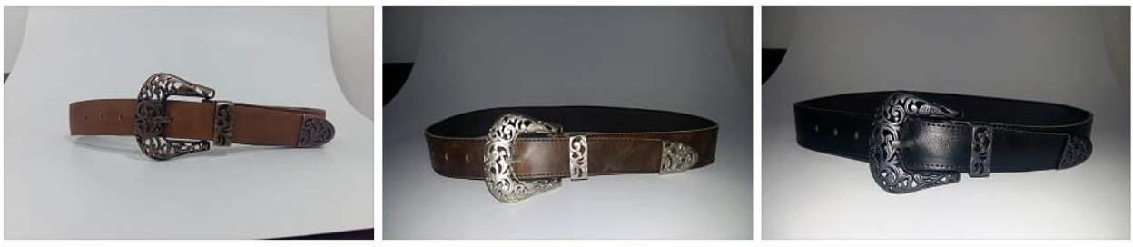
Imagen 1 diseño SH-C100

Estos son algunos de los primeros diseños físicos de la empresa sur herrajes, gracias al excelente desempeño del equipo de trabajo.