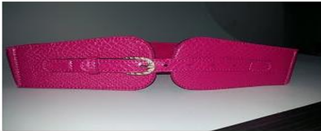
Imagen 4 diseño SH-C127