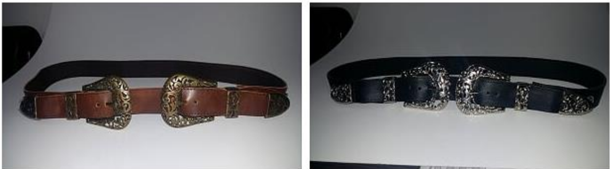
Imagen 5 diseño SH-C101