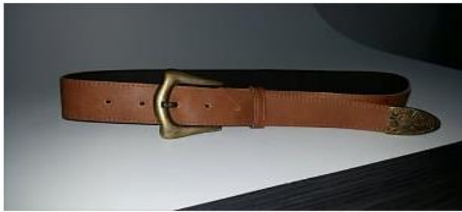
Imagen 3 diseño SH-C116