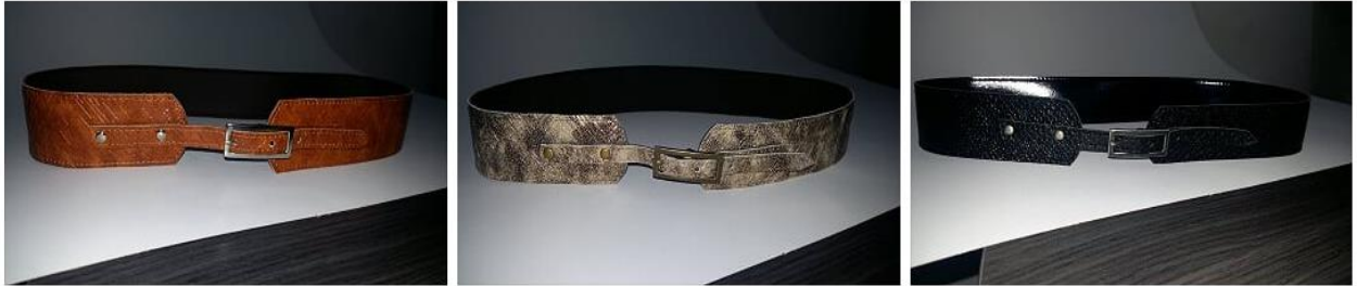
Imagen 2 diseño SH-C149