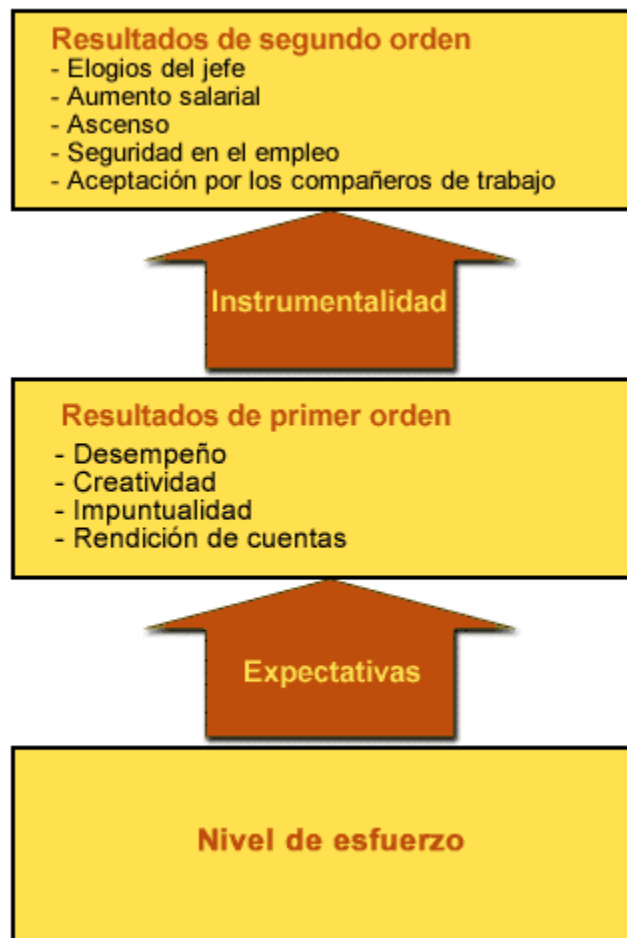
Gráfico 2. Conceptos básicos del modelo de expectativas.