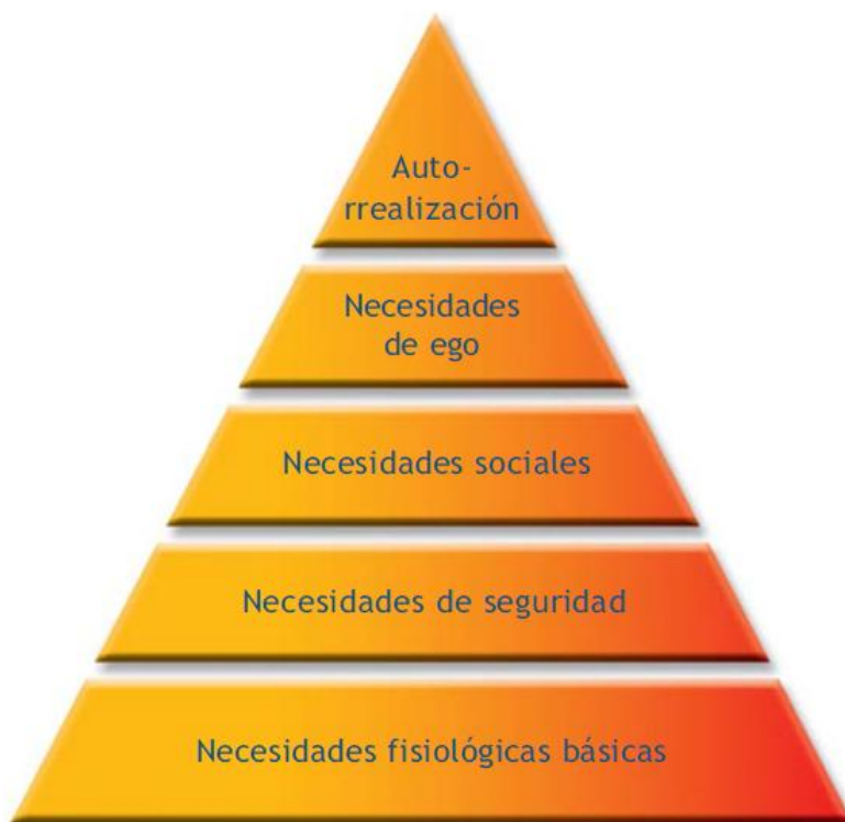
Gráfico 1. Jerarquía de necesidades de los individuos según la teoría de Maslow.

Así, en la parte inferior de la pirámide están las necesidades más básicas del individuo y en el nivel superior se sitúan sus últimos deseos o aspiraciones, ya que el afán de superación es intrínseco al ser humano (Reeve, 2003, p. 373).