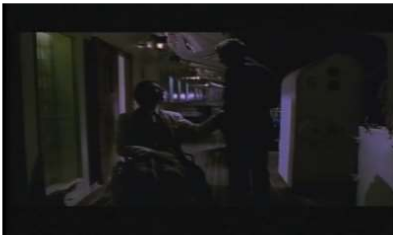
Fotograma, “Bitter Moon”(1992 )Dir. Roman Polanski , Minuto 8:39

Es en esta escena donde Oscar invita a Nigel que escuche erótica historia que vivió con Mimi.