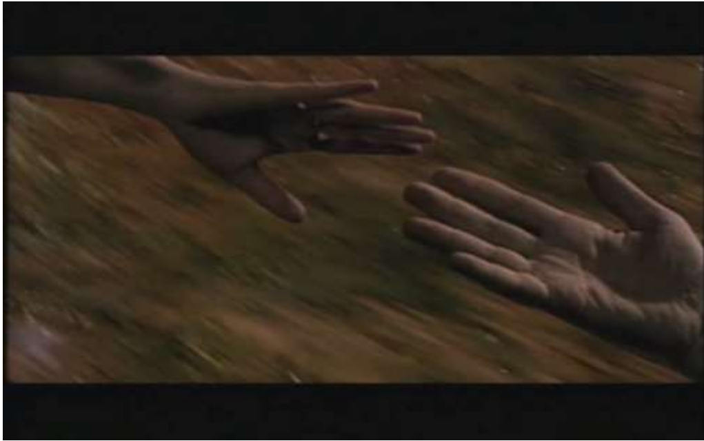
Fotograma, “Bitter Moon”(1992 )Dir. Roman Polanski , Minuto 28:30

caiga de la camilla, dejándolo con un daño irreversible en su columna que le impedirá volver a caminar.