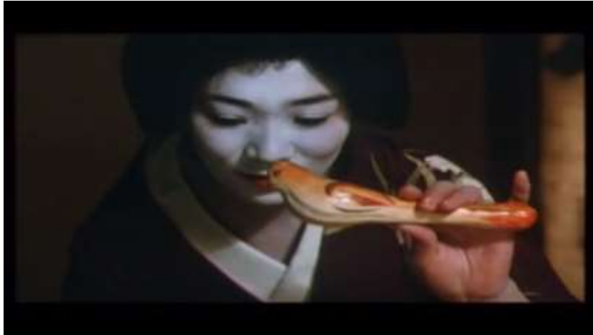
Fotograma “ Ai no Korida” (1976) Dir. Nagisa Oshima, Minuto 27:21

La celebración continúa con música, danza y termina con una orgía en la que participan Kichizo y Sada con las cuatro geishas.