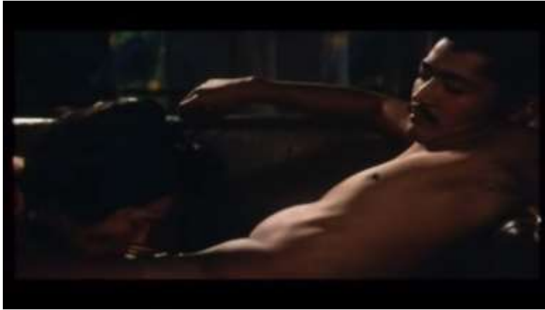
Fotograma “ Ai no Korida” (1976) Dir. Nagisa Oshima, Minuto 16:07