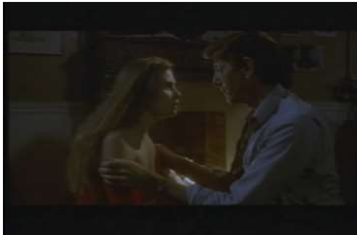
Fotograma, “Bitter Moon”(1992 )Dir. Roman Polanski , Minuto 24:55

El erotismo aparece por primera vez en esta película en la escena en que Mimi y Oscar se dirigen a la casa de él, un departamento pequeño que posee una chimenea, una alcoba y una sala acogedora. Al llegar, ella lleva en su mano un largo pan francés y él unas bolsas. Preparan café, chocolate y croissants, además prenden la chimenea. Con el fuego encendido, se disponen a comer, sin embargo ella no deja de mirarlo fijamente con unos ojos inocentes pero lujuriosos, y como en un encanto el erotismo invadió sus cuerpos, y más que un encuentro sexual se aprecia en la escena como una fuerza que los lleva a consumir todo.