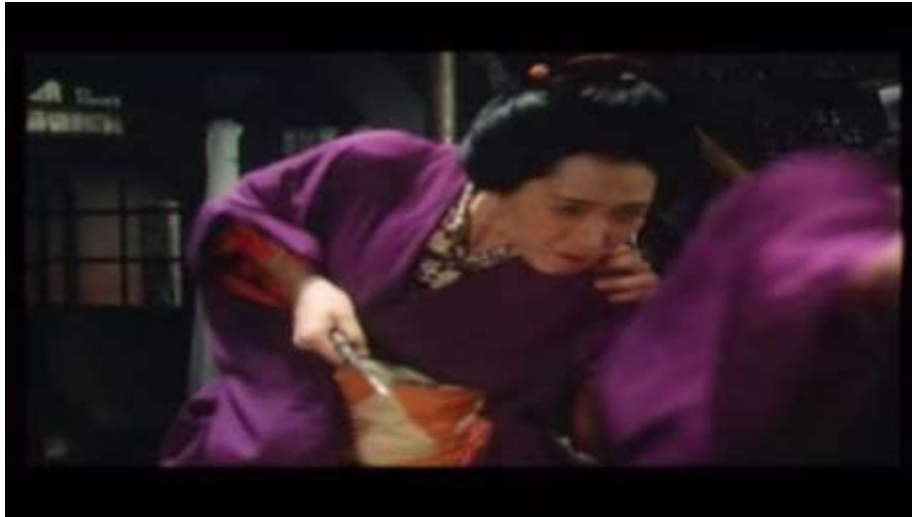
Fotograma “ Ai no Korida” (1976) Dir. Nagisa Oshima, Minuto 7:07

Más adelante, se puede precisar una serie de repeticiones en las que, Kichizo y Sada realizan maratones sexuales, en donde pasan días sin salir de su habitación, solo consumen sake y mantienen relaciones sexuales. Estas maratones sexuales comienzan justo después de su matrimonio, Sada y Kichizo no se separan ni un instante, estos se encuentran en el patio y Kichizo quien le había dicho a Sada que necesitaba orinar para que su cuerpo descansara, le insiste en que debe hacerlo, ella le permite esto, sin embargo, lo sienta en un escalon y sujeta su miembro con las manos para que este pueda orinar y así volver a empezar con las relaciones sexuales.