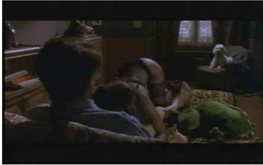
Fotograma, “Bitter Moon”(1992 )Dir. Roman Polanski , Minuto 1:09:37

Al otro día, ya se encuentra en su casa, se dispone a desayunar con Mimi y observa que ella comienza a tener una actitud tosca y come su desayuno no como una dama sino de manera ruda. Enseguida Oscar le muestra su incomodidad y ella le expresa que no le encuentra ningún problema en comer de ese modo, así comienzan una fuerte discusión: