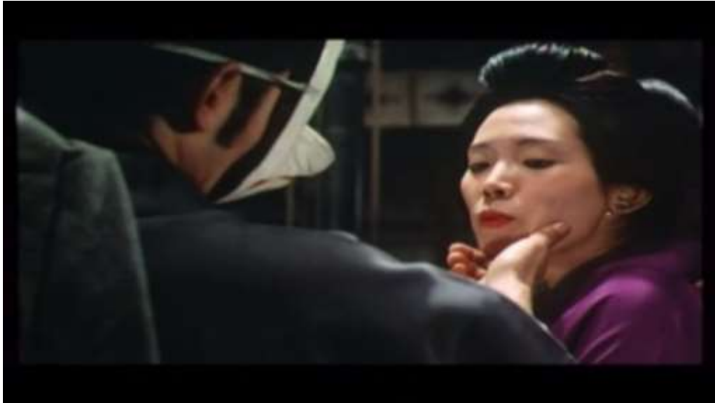
Fotograma “ Ai no Korida ” (1976) Dir. Nagisa Oshima, Minuto 7:41

Kichizo se descubre la cara, le toma la mano a Sada con la que sujeta el cuchillo y le expresa: