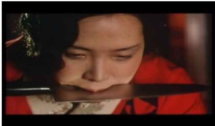
Fotograma “ Ai no Korida” (1976) Dir. Nagisa Oshima, Minuto 1:16:55

sí, te deseo de tal forma que un día usaré el cuchillo.