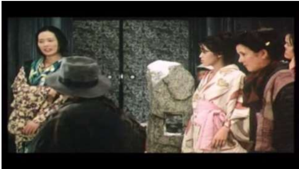
Fotograma “ Ai no Korida” (1976) Dir. Nagisa Oshima, Minuto 5:01

“Yo era uno de tus mejores clientes, tienes que acordarte de mí (...) te deseo, te deseo ahora mismo, mira eno dinero puedo pagarte.”