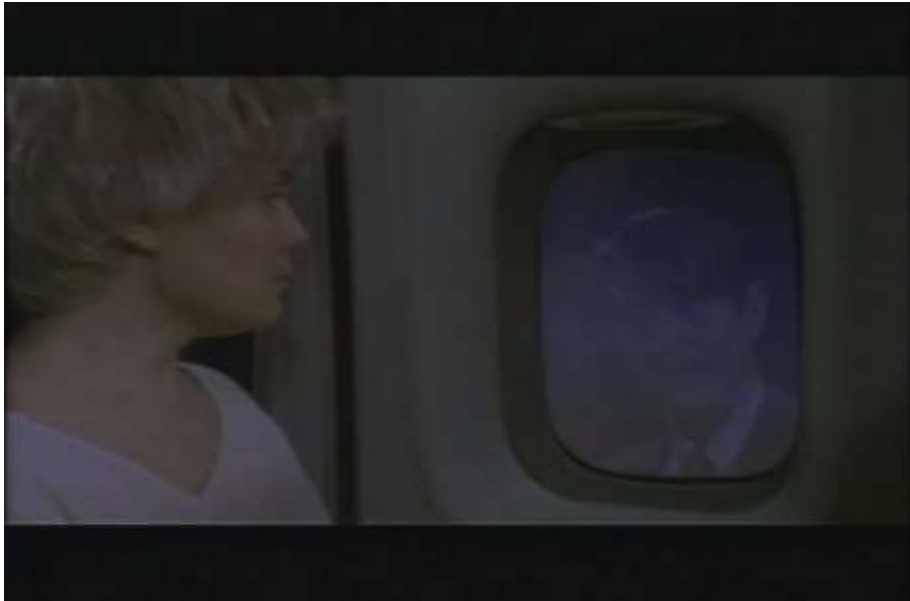
Fotograma, “Bitter Moon”(1992 )Dir. Roman Polanski , Minuto1:29:14

y cuando se disponen a subir al avión, Oscar finge estar enfermo para que lo dejen bajar, enviando a Mimi sola a otro país y liberándose de ella, de lo que creía él para siempre.