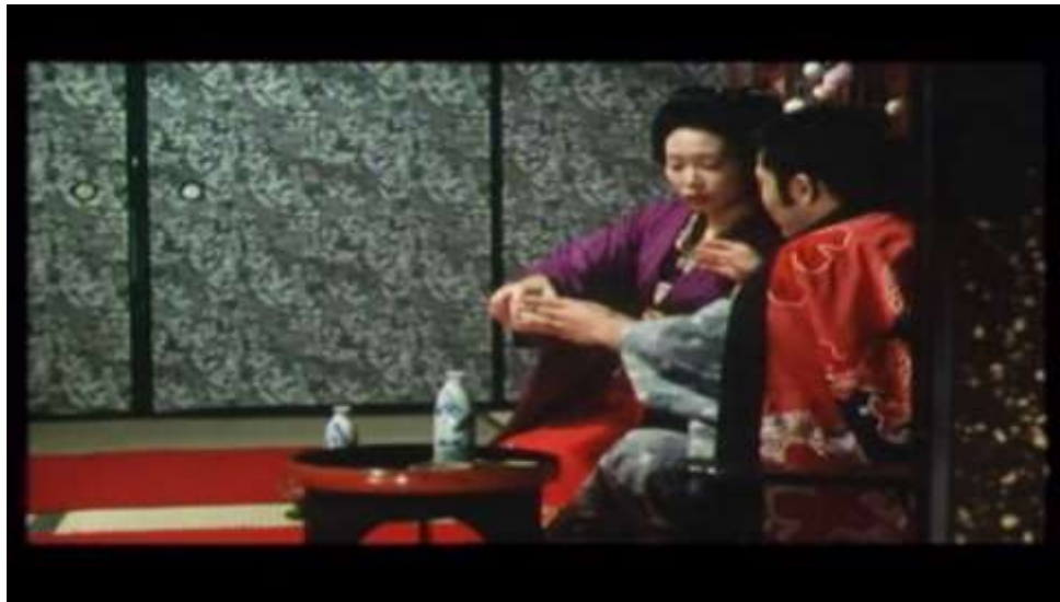
Fotograma “ Ai no Korida” (1976) Dir. Nagisa Oshima, Minuto 10:45

Kichizo se dispone a tomar un sorbo de sake, es en este momento donde Sada y él tienen su primer encuentro sexual.