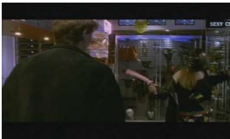
Fotograma, “Bitter Moon”(1992 )Dir. Roman Polanski , Minuto 43:43

Ahora bien, lo erótico continua en las escenas del pasado donde Oscar y Mimi se encuentran en una tienda erótica, él está observando un objeto y ella sigilosamente se le acerca por detrás, lleva puesta una máscara de sadomasoquismo y una capa, con su dedo toca el hombro de Oscar, él voltea y ella está sacándole la lengua por el agujero que tiene la máscara cerca a la boca, él se ríe y ella como si fuera un mosquetero saca un pene de plástico simulando que es una espada. Salen riendo de la tienda, al llegar a casa pasa lo esperado, el juego sexual.