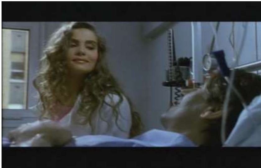
Fotograma, “Bitter Moon”(1992 )Dir. Roman Polanski , Minuto 1:39:04

En un tono sarcástico Oscar la invita a sentarse y le indaga que en donde a estado en todo este tiempo y porqué había vuelto, ella le responde que el motivo de su visita era para mirar si necesitaba algo, sin embargo el de forma grotesca y cruel le exclama que lo único que necesita es que no se meta en la vida de él, ella sin mayor resentimiento, se despide y cuando va a darle la mano, se acerca lentamente -como en la escena de las manos en el carrusel- y en un impulso lo tumba de la camilla, dejándolo inválido.