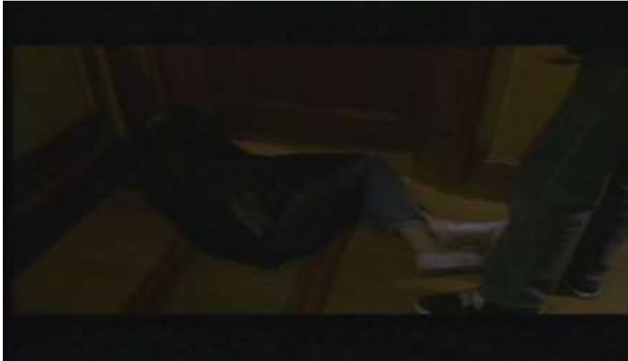
Fotograma, “Bitter Moon”(1992 )Dir. Roman Polanski , Minuto 1:17:32

Ella se levanta y le expresa que lo estaba esperando, pues necesita hablar con él, Oscar se niega diciendole que quiere ir a dormir pero ella es insistente en que necesita decirle algo, aunque Oscar le diga que ya no hay nada más que decir. Ella le ruega llorando y a lo último el accede a escucharla debido a que sus vecinos se estaban enterando de la situación. Mimi entra a la casa, él le dice: