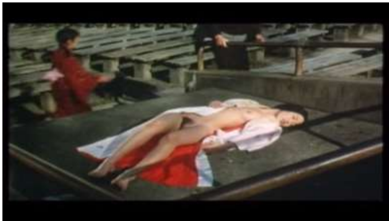
Fotograma “ Ai no Korida” (1976) Dir. Nagisa Oshima, Minuto 1:32:24

Finalmente, existe una escena en la hay una representación onírica que tiene Sada justo después de asesinar a Kichizo. Ella se encuentra acostada como en un tipo de parque, lleno de estantes. Ella se encuentra desnuda solo lleva un kimono abierto que medio la cubre y alrededor de ella corren un hombre y una niña, que pronuncian las palabras “¿donde está?, aún no estoy allí” repetidas veces. Sada abre los ojos en el sueño, comienza a ver a su alrededor confundida y finalmente grita ¡Kichi-san! Para luego despertar y encontrar a Kichizo ya muerto.