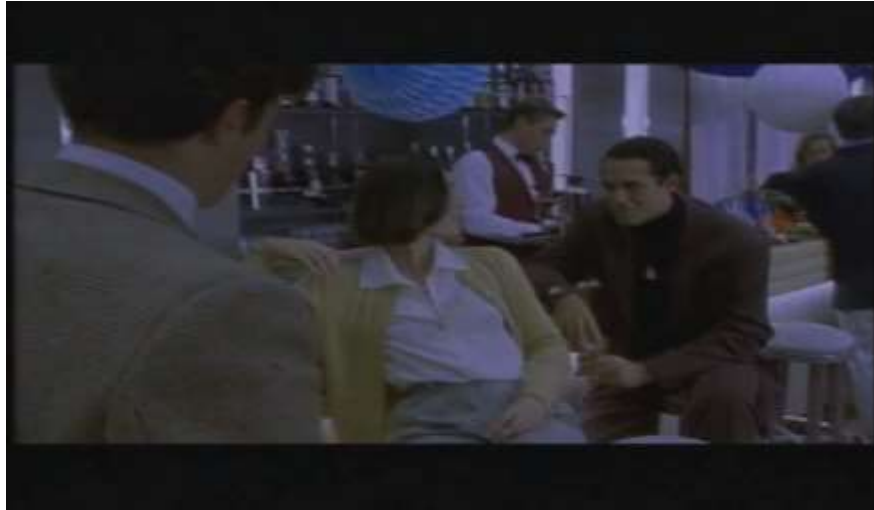
Fotograma, “Bitter Moon”(1992 )Dir. Roman Polanski , Minuto1:32:50