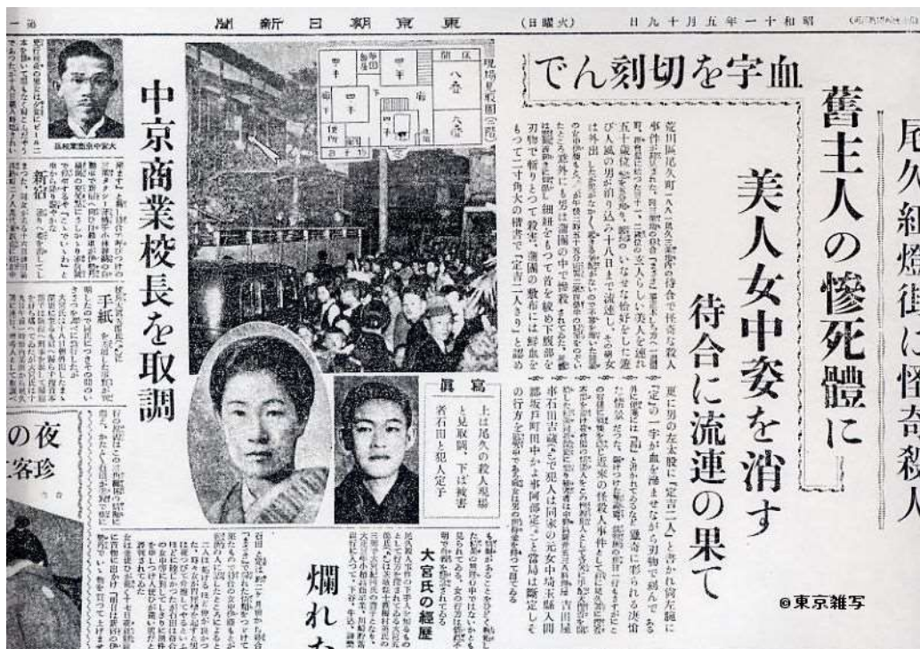
Fotografía de la noticia del crimen de Sada Abe en un periódico japonés.

“El 18 de Mayo de 1936, durante una maratón sexual Sada Abe asesinó a Kichizo Ishida asfixiándolo con su faja Obi . Cortó los genitales de su amante y los envolvió en una hoja de revista. Escribió con sangre sobre su pierna ‘Sada y Kichi, juntos’. Se quedó abrazando el cuerpo durante un tiempo y huyó. El crimen se descubrió al otro día y la noticia fue sensación en todo Japón. La gente temía encontrarse a la mujer por la calle y se desató el terror. Pocos días después fue arrestada, confesó abiertamente el crimen y fue encontrada con el miembro mutilado de su amante. Cuando le preguntaron porqué había matado a Kichizo Ishida ella contestó: <<por amor>>” (Militancia Erótica, 2013, pár. 11)