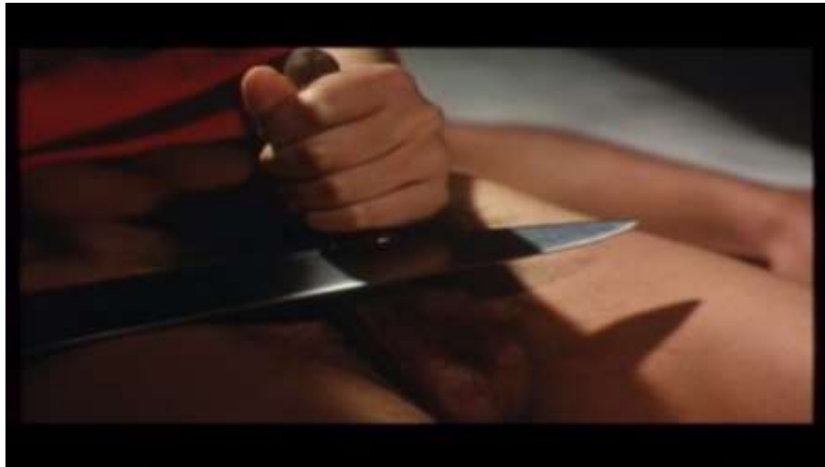
Fotograma “ Ai no Korida” (1976) Dir. Nagisa Oshima, Minuto 1:34:38

Luego con la sangre escribe en el cuerpo de Kichizo: “Kichi y Sada juntos, nada más que nosotros dos”