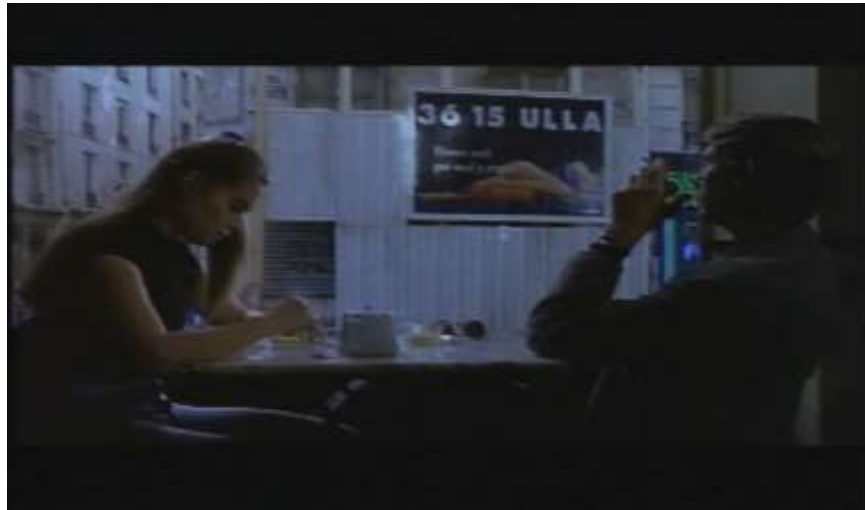
Fotograma, “Bitter Moon”(1992 )Dir. Roman Polanski , Minuto 1:07:32