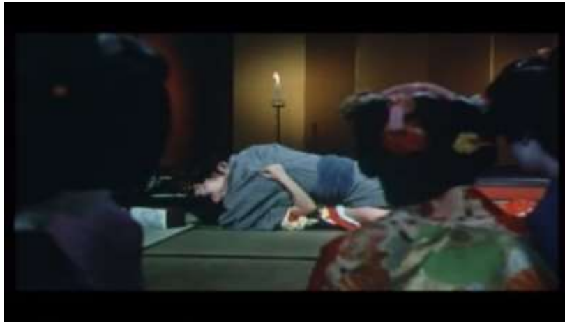
Fotograma “ Ai no Korida” (1976) Dir. Nagisa Oshima, Minuto 26:41

En ese momento, una de las geishas quien se estaba resistiendo a mirar, es incitada por las otras a que observe. A la fuerza le dicen que observe pues sería bueno para ella conocer más a los hombres, luego le quitan el kimono y comienzan a acariciarle el cuerpo y mientras tres geishas la someten una le introduce en su genital, un objeto de madera alargado en forma de pájaro.