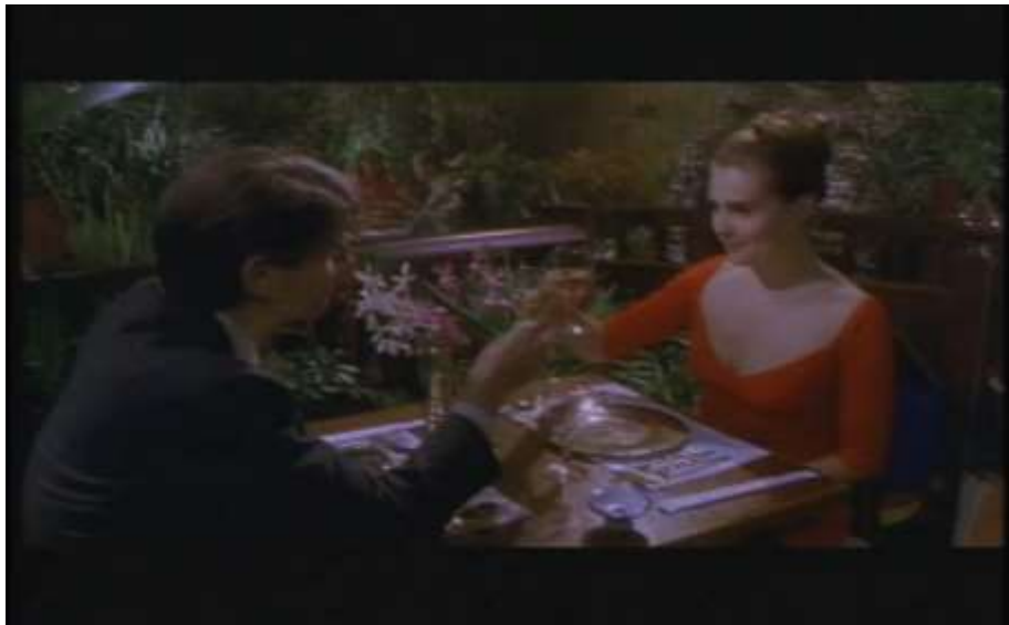
Fotograma, “Bitter Moon”(1992 )Dir. Roman Polanski , Minuto 19:10

Oscar y Mimi, se encontraron a las afueras de una academia de baile a la que ella asistía, al fondo suena una música alegre, y al mismo tiempo se escucha otra música, pero en este caso seductora. Se dirigen a cenar a un restaurante tailandés. La actitud de ella es de una chica inocente, callada pero tentadora, estaba vestida con un cautivador vestido rojo y Oscar estaba formal pero muy bien arreglado. Él trata de impresionarla, haciendo diferentes movimientos, los cuales ella repite.