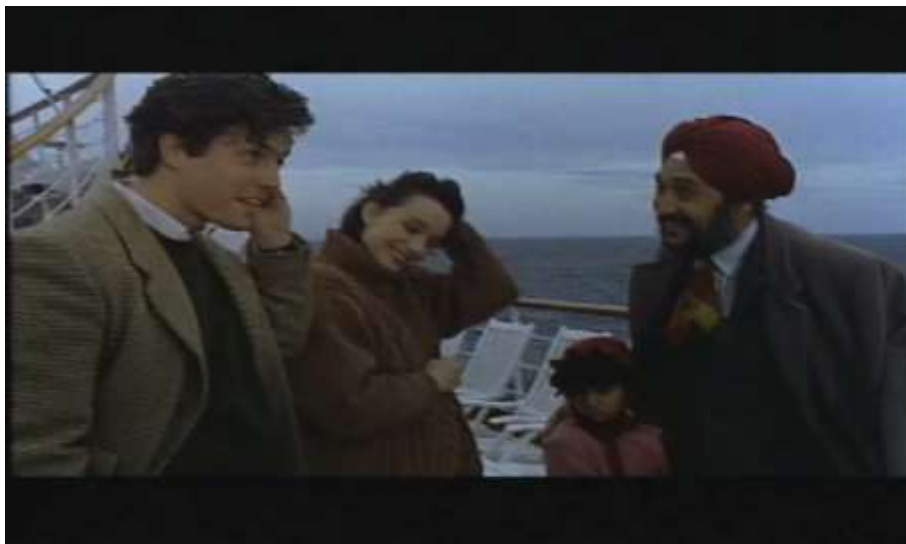
Fotograma, “Bitter Moon”(1992 )Dir. Roman Polanski , Minuto 55:34

Creame, tener hijos es la mejor terapia matrimonial, más que cualquier viaje a la india.