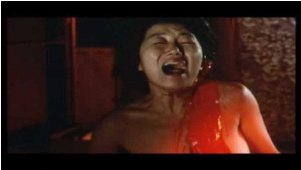
Fotograma “ Ai no Korida” (1976) Dir. Nagisa Oshima, Minuto 20:33

Sin embargo la escena regresa la realidad y solo se ve a estos dos en el coito, mientras esto la ama le dice a Sada