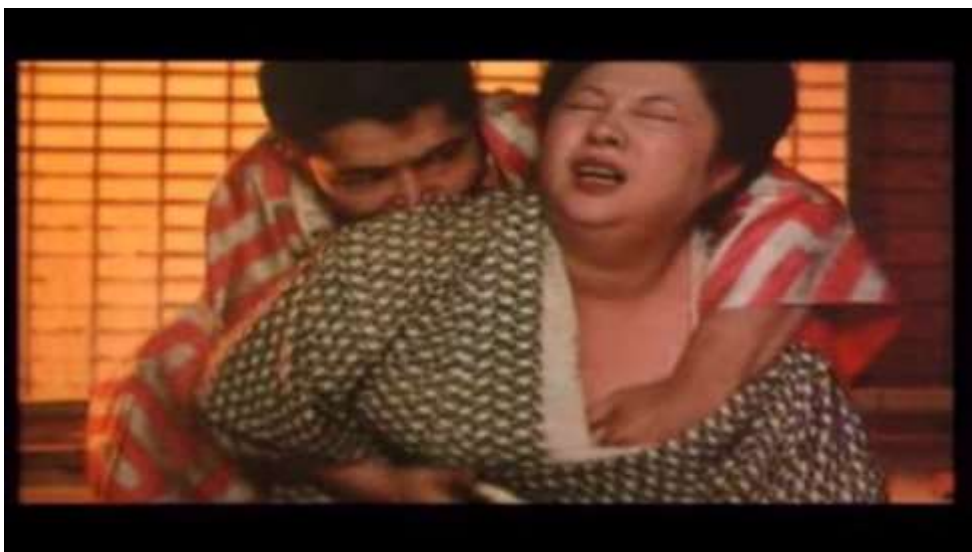
Fotograma “ Ai no Korida” (1976) Dir. Nagisa Oshima, Minuto 40:51

Kichizo sin pronunciar una palabra, agarra del kimono a la sirvienta, la somete y la obliga a tener relaciones sexuales con él.