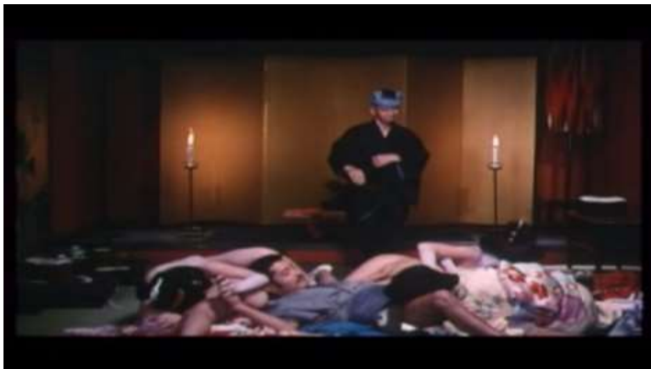
Fotograma “ Ai no Korida” (1976) Dir. Nagisa Oshima, Minuto 28:36

La celebración continúa con música, danza y termina con una orgía en la que participan Kichizo y Sada con las cuatro geishas.