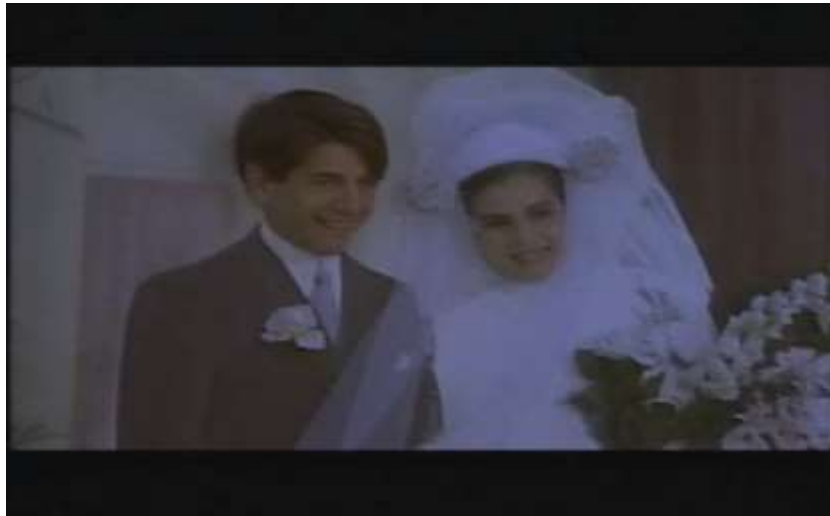
Fotograma, “Bitter Moon”(1992 )Dir. Roman Polanski , Minuto 29:06