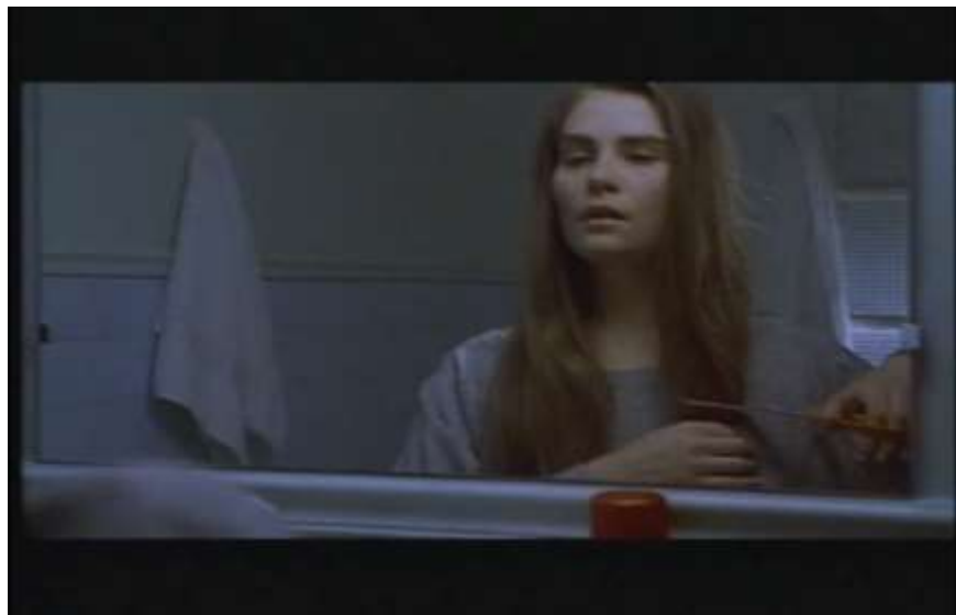
Fotograma, “Bitter Moon”(1992 )Dir. Roman Polanski , Minuto 1:20:01

Desde ese momento, comienzan una serie de sucesos que demuestran una denigración física y psicológica de Oscar hacia Mimi, se observa como Mimi, pierde su belleza, su vestimenta cambia y se corta algo esencial en ella que es su hermoso cabello.