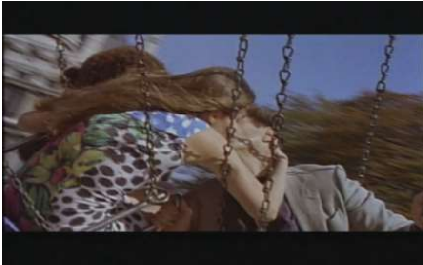
Fotograma, “Bitter Moon”(1992 )Dir. Roman Polanski , Minuto 29:04