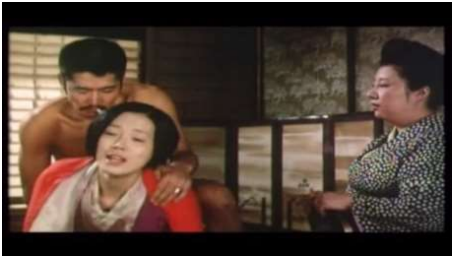
Fotograma “ Ai no Korida” (1976) Dir. Nagisa Oshima, Minuto 37:21

habitación. La sirvienta le pregunta que que debe de hacer con las Geishas, Sada permite que vayan pero solo si Kichizo quiere. Cuando Sada está a punto de irse, él en un impulso la somete para volver a tener relaciones con ella sin importarle la presencia de la sirvienta.