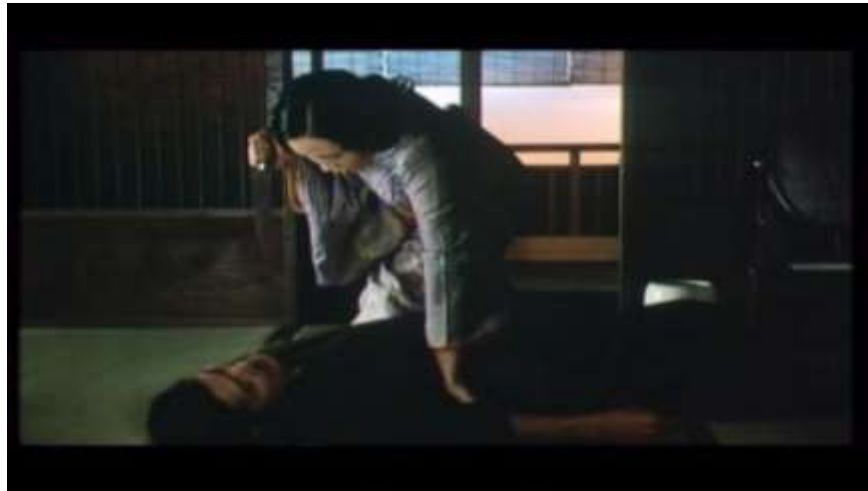
Fotograma “ Ai no Korida” (1976) Dir. Nagisa Oshima, Minuto 58:41

Ahora bien, el goce se puede apreciar en las palabras que se dicen Kichizo y Sada, mientras experimentan estrangularse mientras tienen relaciones sexuales. Así, Kichizo quien es el primer en estrangular a Sada, siente temor al apretarle demasiado el cuello y pese a que ella le dice que continúe sin miedo, él la suelta; ella le dice: