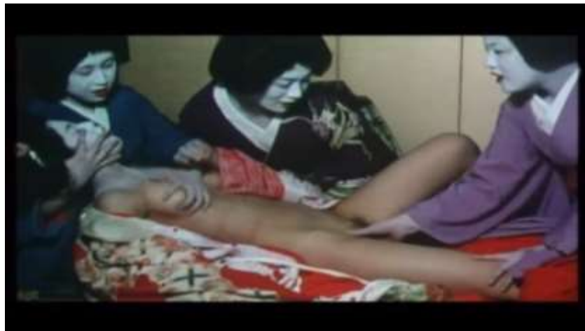
Fotograma “ Ai no Korida” (1976) Dir. Nagisa Oshima, Minuto 27:13

En ese momento, una de las geishas quien se estaba resistiendo a mirar, es incitada por las otras a que observe. A la fuerza le dicen que observe pues sería bueno para ella conocer más a los hombres, luego le quitan el kimono y comienzan a acariciarle el cuerpo y mientras tres geishas la someten una le introduce en su genital, un objeto de madera alargado en forma de pájaro.