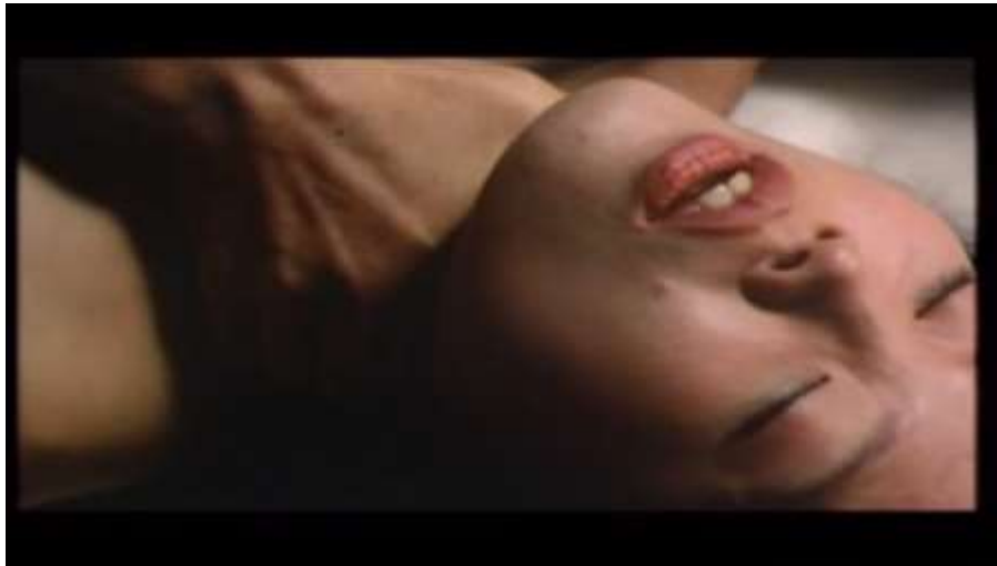
Fotograma “ Ai no Korida ” (1976) Dir. Nagisa Oshima, Minuto 1:03:48

Así que Kichizo y Sada cambian su posición y ahora es Sada quien comienza a estrangular a Kichizo para su satisfacción sexual.