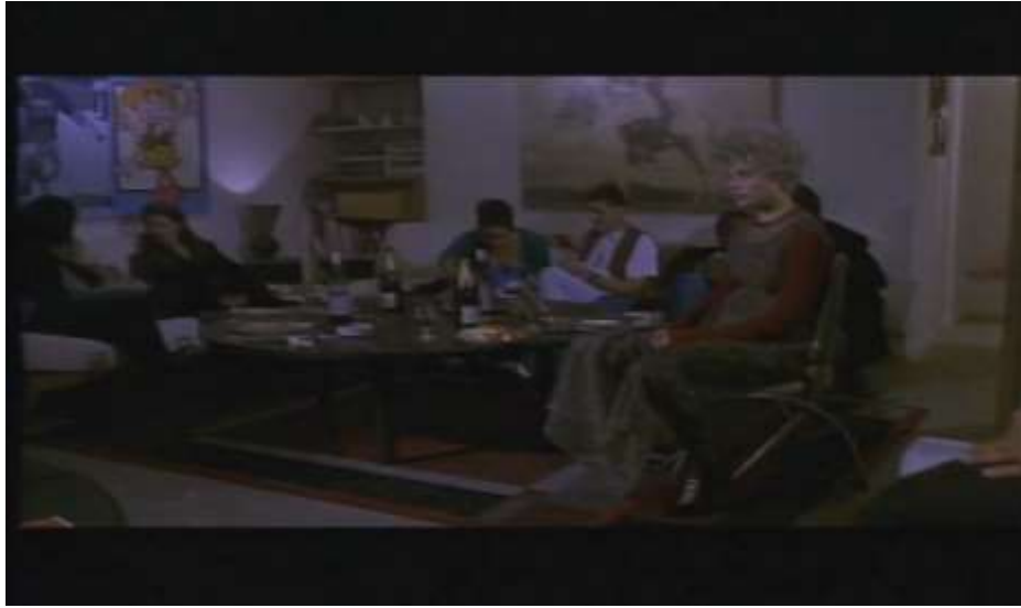
Fotograma, “Bitter Moon”(1992 )Dir. Roman Polanski , Minuto 1:22:01