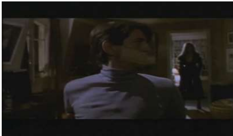
Fotograma, “Bitter Moon”(1992 )Dir. Roman Polanski , Minuto 44:15

Otra de las escenas que marcan lo que sería el exceso en la película “Lunas de hiel”, se remite a las practicas sadomasoquistas a las que llegan Oscar y Mimi.