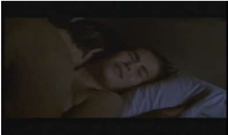
Fotograma, “Bitter Moon”(1992 )Dir. Roman Polanski , Minuto 1:19:51

Desde ese momento, comienzan una serie de sucesos que demuestran una denigración física y psicológica de Oscar hacia Mimi, se observa como Mimi, pierde su belleza, su vestimenta cambia y se corta algo esencial en ella que es su hermoso cabello.