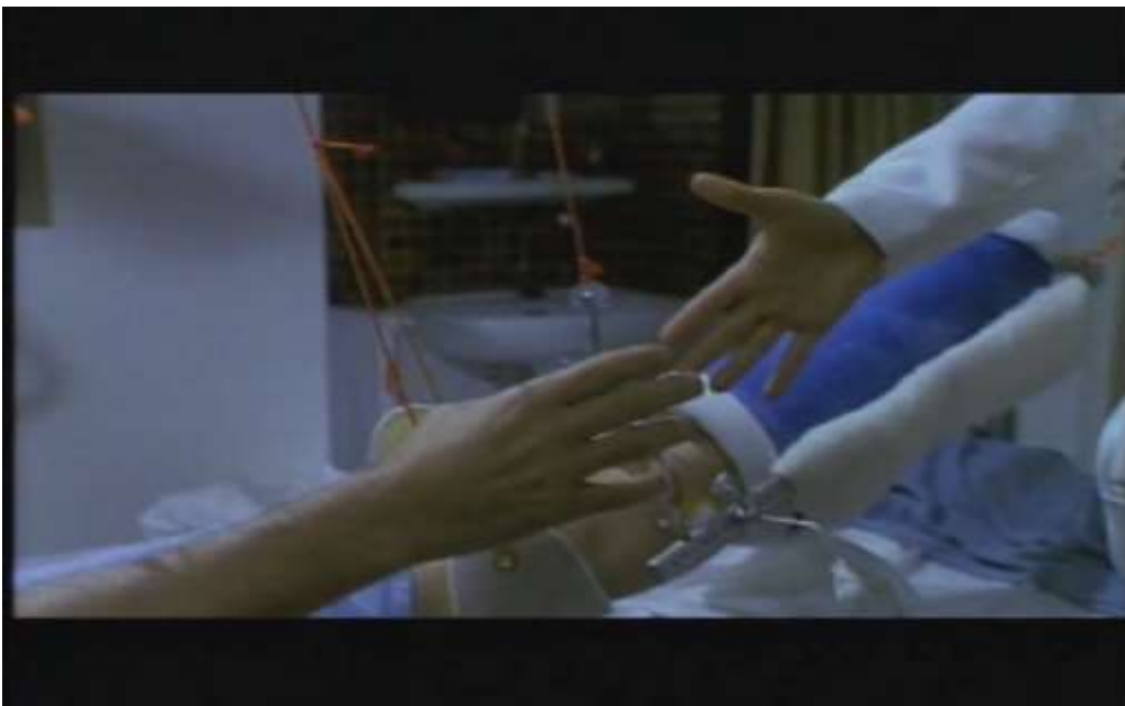
Fotograma, “Bitter Moon”(1992 )Dir. Roman Polanski , Minuto 1:40:19