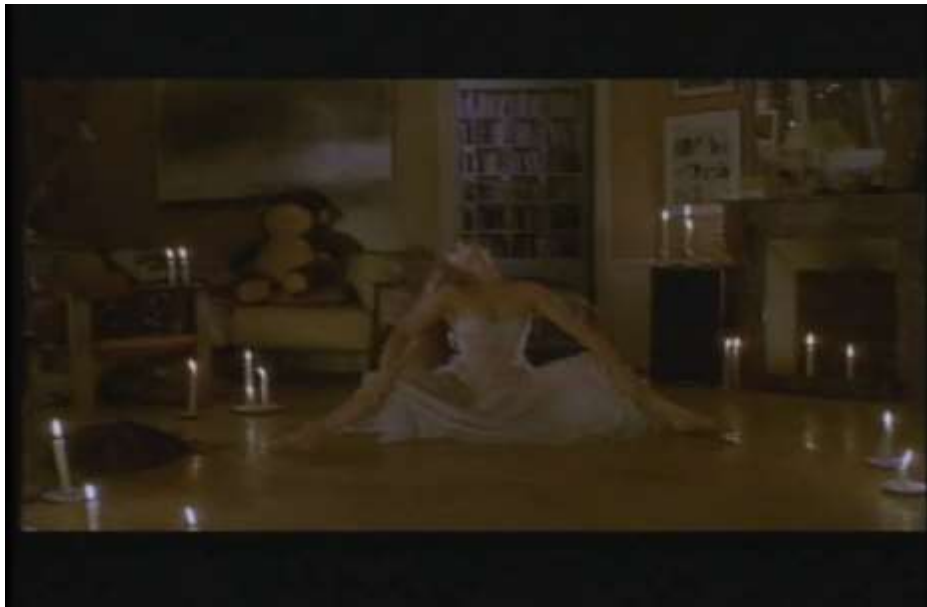
Fotograma, “Bitter Moon”(1992 )Dir. Roman Polanski , Minuto 29:35

vestido blanco semitransparente y por el cual se puede apreciar su cuerpo desnudo. El baile termina de una manera abrupta en la que Mimi, se lanza al suelo fuertemente como en forma de reverencia hacia Oscar, casi que podría decirse, entregándose a él.