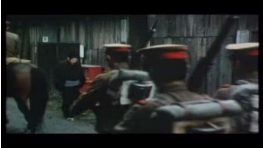
Fotograma “ Ai no Korida” (1976) Dir. Nagisa Oshima, Minuto 1:15:14

Finalmente, existe una escena en la hay una representación onírica que tiene Sada justo después de asesinar a Kichizo. Ella se encuentra acostada como en un tipo de parque, lleno de estantes. Ella se encuentra desnuda solo lleva un kimono abierto que medio la cubre y alrededor de ella corren un hombre y una niña, que pronuncian las palabras “¿donde está?, aún no estoy allí” repetidas veces. Sada abre los ojos en el sueño, comienza a ver a su alrededor confundida y finalmente grita ¡Kichi-san! Para luego despertar y encontrar a Kichizo ya muerto.