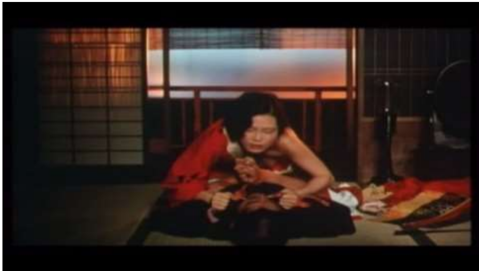
Fotograma “ Ai no Korida ” (1976) Dir. Nagisa Oshima, Minuto 1:21:58

Ella le coloca el obi alrededor del cuello, introduce el miembro de Kichizo dentro de ella y comienza a estrangularlo. Cabe destacar que esta escena es la que introduce de una mas explícita, la penetración. Sada, aprieta cada vez más fuerte el cuello del Kichizo, tanto que cada vez siente más placer.