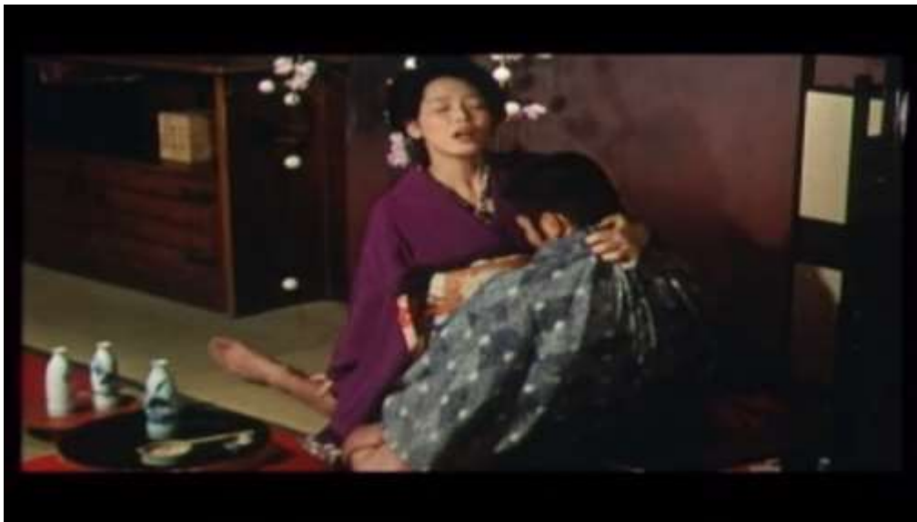
Fotograma “Ai no Korida” (1976) Dir. Nagisa Oshima, Minuto 12:26

El procese entonces a descubrir su miembro y sienta a Sada encima de él.