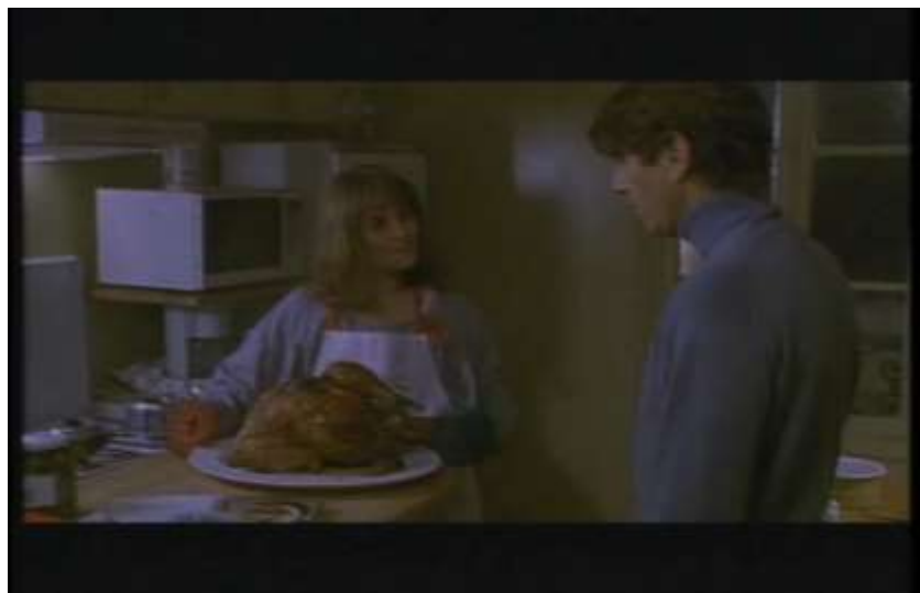
Fotograma, “Bitter Moon”(1992 )Dir. Roman Polanski , Minuto 1:21:13