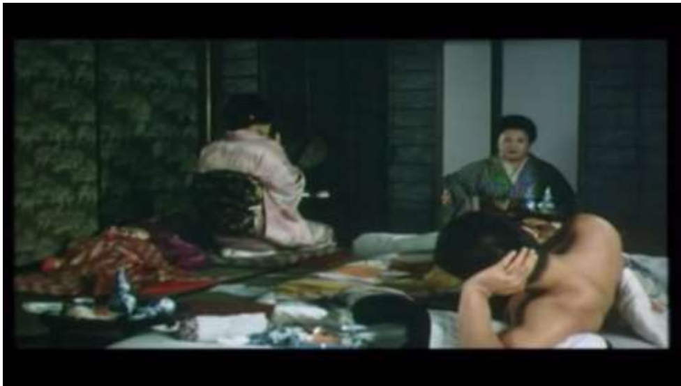
Fotograma “ Ai no Korida” (1976) Dir. Nagisa Oshima, Minuto 35:55

Quiere decir que siempre lo tengo en la boca