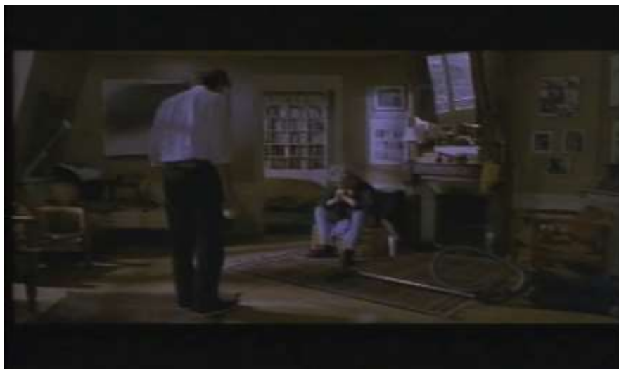
Fotograma, “Bitter Moon”(1992 )Dir. Roman Polanski , Minuto 1:24:41

Mirame, ¿parezco un papá?, ¿nos imaginas criando a un niño aquí? Tengo casi 40 y no he vendido ni un libro. El mundo no sabe de mi existencia. Cada día que pasa creo que es mejor suicidarme. ¿sería justo que un niño tuviera un padre así?