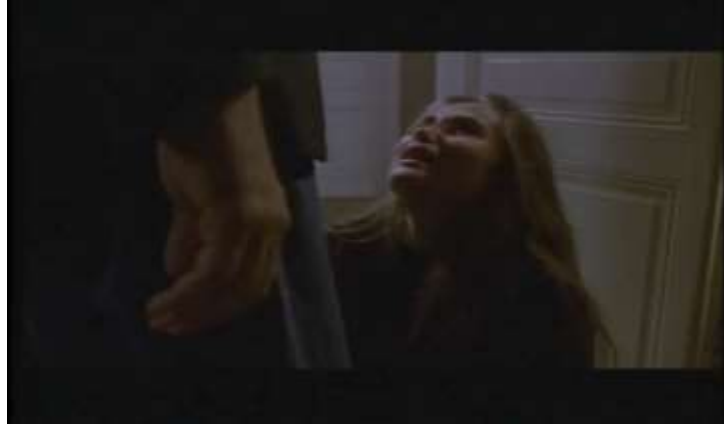
Fotograma, “Bitter Moon”(1992 )Dir. Roman Polanski , Minuto 1:19:04

ames, aunque sea por lástima, haría lo que fuera por estar contigo ¡por favor! ¡por favor! Te lo ruego- comienza a besarle los pies.