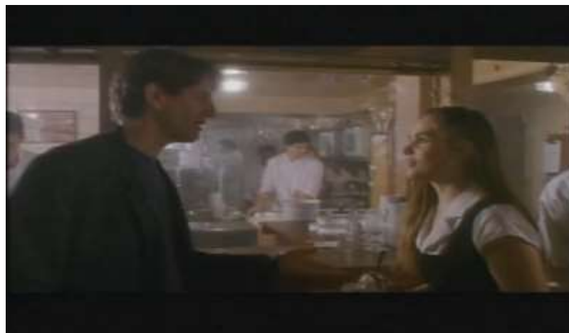
Fotograma, “Bitter Moon”(1992 )Dir. Roman Polanski , Minuto 17:53

Cuando se encontraban en el restaurante, jamás imaginó lo que le sucedería, frente a sus ojos, se encontraban aquellos tenis blancos que había visto en el autobús. Era la camarera, Mimi trabajaba en este lugar y cuando la vio, quedó atrapado, tanto que no tuvo otra opción que seguirla y hablarle para invitarla a salir