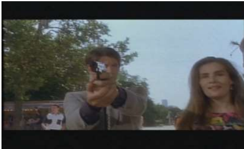
Fotograma, “Bitter Moon”(1992 )Dir. Roman Polanski , Minuto 27:15

La segunda escena que manifiesta elementos simbólicos es aquella donde Oscar y Mimi se encuentran en una feria, allí se muestra un plano en el que Oscar apunta con un arma y Mimi observa a lo que apunta como si fuera complice de lo que ocurrirá, sin embargo, en un segundo plano muestran que es un juego, en el que disparan a un cuadro con el fin de ganar un premio, si bien este revolver vuelve a aparecer en dos ocasiones más en la película, y es Oscar quien porta este objeto.