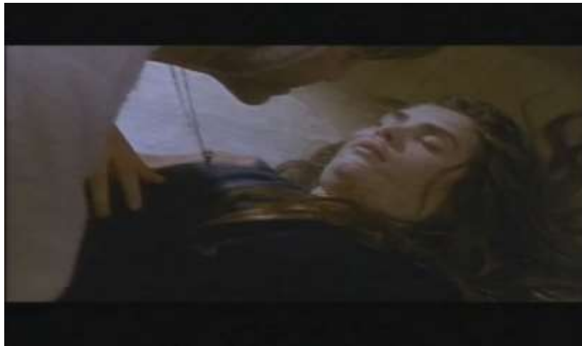
Fotograma, “Bitter Moon”(1992 )Dir. Roman Polanski , Minuto 1:11:40

Oscar intenta levantar a Mimi expresándole que deje el espectáculo, sin embargo ella no responde y cuando Oscar se da cuenta de que realmente se encuentra desmayada, éste se asusta y decide llamar a emergencias, allí miente en lo sucedido y solo explica que derrepente Mimi se desmayó, sin embargo ella despertó antes de que él diera la dirección para que viniera la ayuda. Ella se queja de dolor en su cabeza, sin embargo al ver a Oscar ella solo le pide que la abrace, el lo hace y le pide perdón, asustado por las consecuencias legales de su acto.