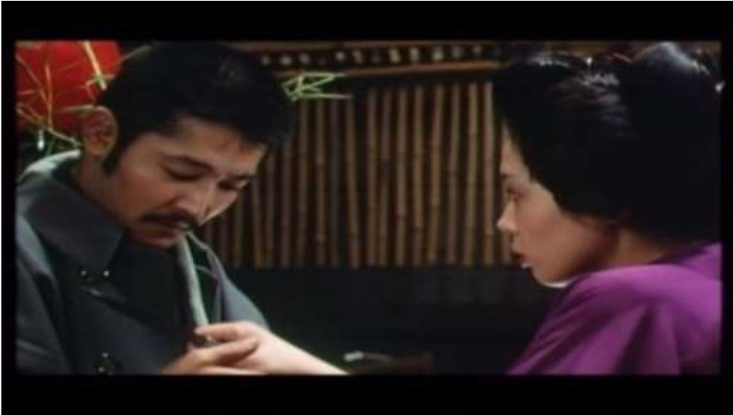
Fotograma “ Ai no Korida” (1976) Dir. Nagisa Oshima, Minuto 8:02

Seguidamente, Kichizo tiene un segundo encuentro con Sada, esta vez va más allá. Él la encuentra fregando los pisos a mano, allí la interrumpe y le dice: