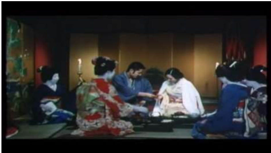
Fotograma “ Ai no Korida” (1976) Dir. Nagisa Oshima, Minuto 23:50

Allí mismo, en este lugar, Sada y Kichizo se unen en matrimonio, con una tradicional celebración japonesa, esto lo hacen acompañados de algunas geishas que atestiguan su unión.