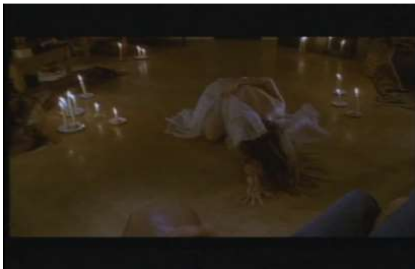
Fotograma, “Bitter Moon”(1992 )Dir. Roman Polanski , Minuto 30:18