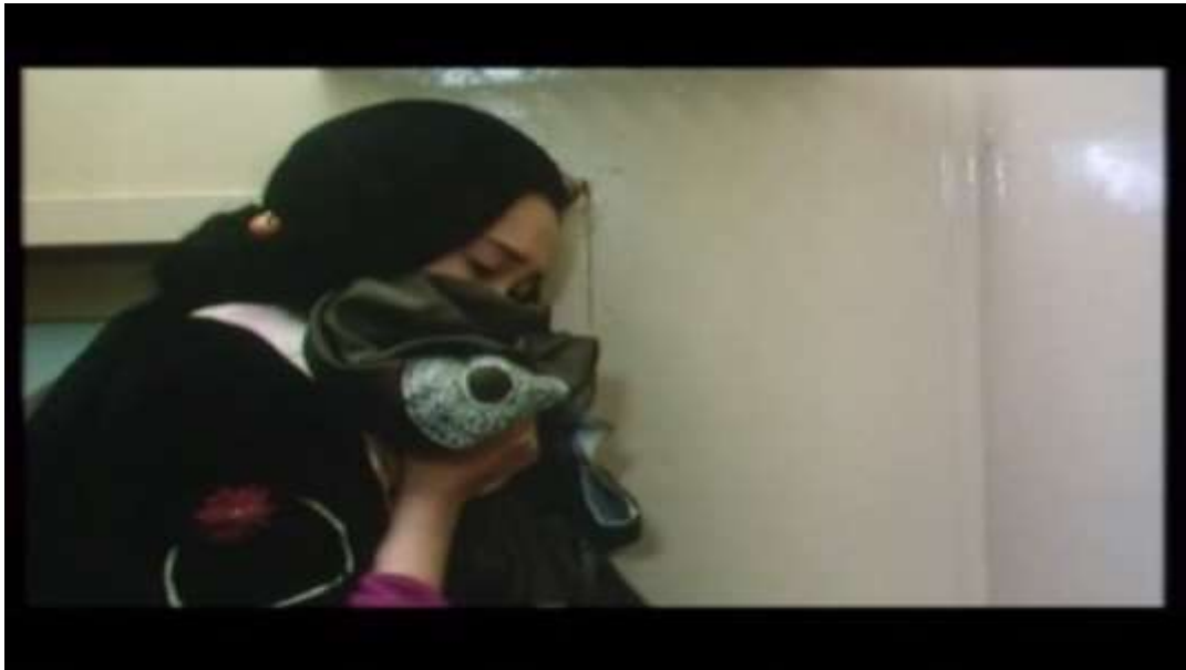
Fotograma “ Ai no Korida” (1976) Dir. Nagisa Oshima, Minuto 39:50

Otra representación de la crueldad aparece en los últimos minutos de la película, en donde sale a relucir una escena que introduce de una manera simbólica lo que sería la muerte de Kichizo. Así, se ve a Kichizo, quien sale de una barbería, caminando de nuevo a la casa que comparte con Sada, la cual no se encuentra pues está prestando sus servicios al intelectual. Mientras se dirige allá, Kichizo de muestra pensativo, se adentra en una calle donde en ese momento se encuentran despidiendo al pelotón de guerra que se dirige a combatir. Estos soldados pasan al lado suyo, se dirigen de lado contrario y con una actitud honorífica, contraria a la de Kichizo que se encuentra nostálgico. Así, se revela, un sentido de sacrificio en el que estos hombres (tanto Kichizo como los soldados) se dirigen hacia su muerte pero con la aceptación de la misma.