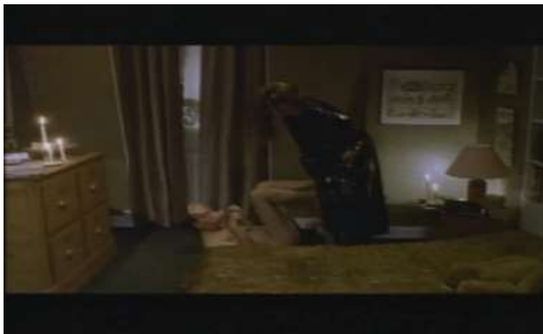
Fotograma, “Bitter Moon”(1992 )Dir. Roman Polanski , Minuto 51:43

“Nos encerramos con nuestros juguetes, no salíamos nunca, no veíamos a nadie, supongo que es demasiado para cualquier pareja”