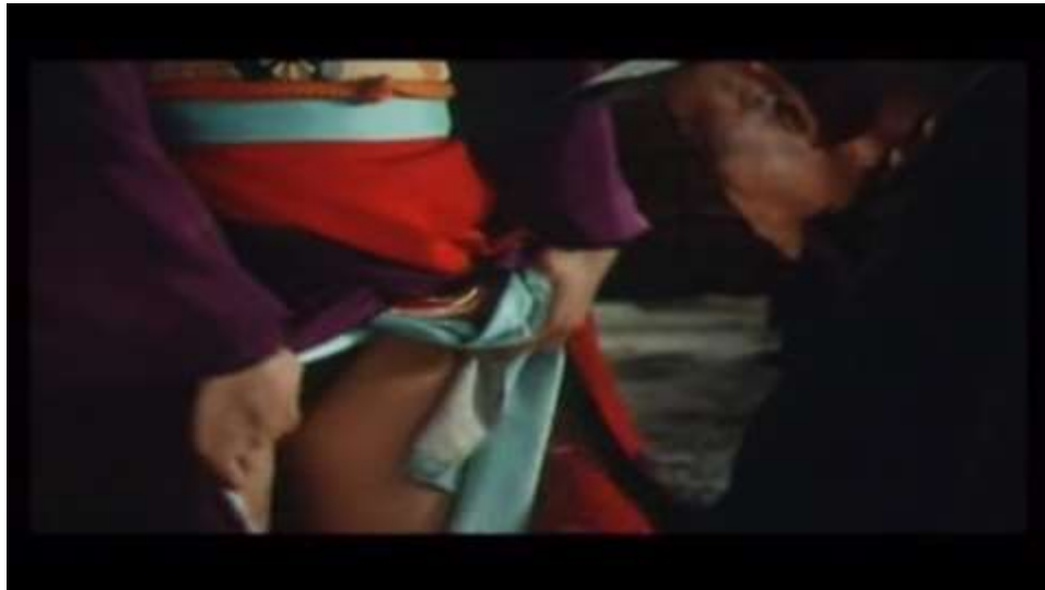
Fotograma “ Ai no Korida” (1976) Dir. Nagisa Oshima, Minuto 6:04

Él le expresa que quiere que ella le muestre sus genitales esperando que esto lo ayude en su erección, Sada accede, sin embargo no funciona aunque este trate con la masturbación. Finalmente, Sada le dice que es mejor que se valla y con su mano da toquesitos en el genital del vagabundo como una manera comprensiva y expresa: ¡pobrecito! .