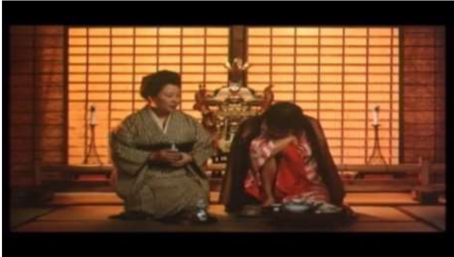
Fotograma “ Ai no Korida” (1976) Dir. Nagisa Oshima, Minuto 40:03

Después de un momento en silencio, se dirige a Kichizo y le dice: