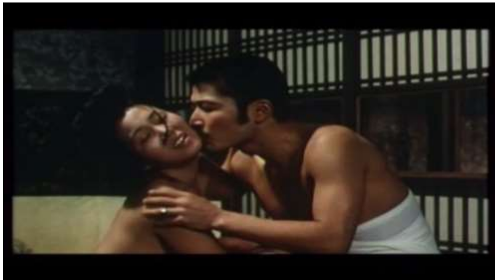
Fotograma “ Ai no Korida” (1976) Dir. Nagisa Oshima, Minuto 2:58

Más adelante se aprecia una escena en la que Sada regresa del mercado acompañada de sus compañeras y encuentran a un vagabundo que esta siendo molestado por unos niños, una niña con una bandera le sube el ropaje y le descubre los genitales, todos se aterran excepto Sada que se queda mirando, allí el vagabundo despierta y reconoce a Sada como la más guapa de un burdel