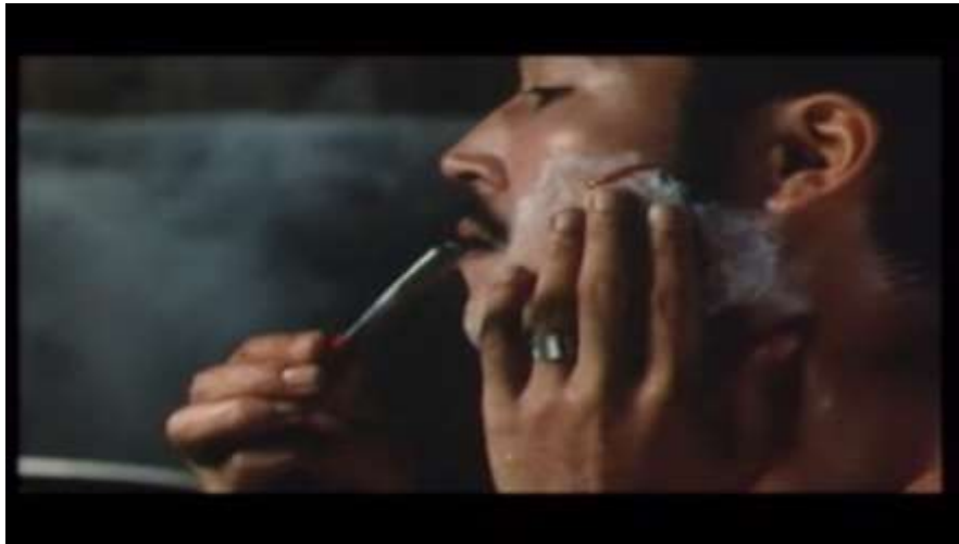
Fotograma “ Ai no Korida” (1976) Dir. Nagisa Oshima, Minuto 56:23

Su esposa, lo asiste, limpia la sangre de kichizo con su boca, recoge agua y comienza a bañarlo, cuando llega a su vientre, baja para tocar su miembro, en ese momento hay silencio, ella frustrada se deja llevar por el momento al igual que él y terminan teniendo relaciones sexuales.