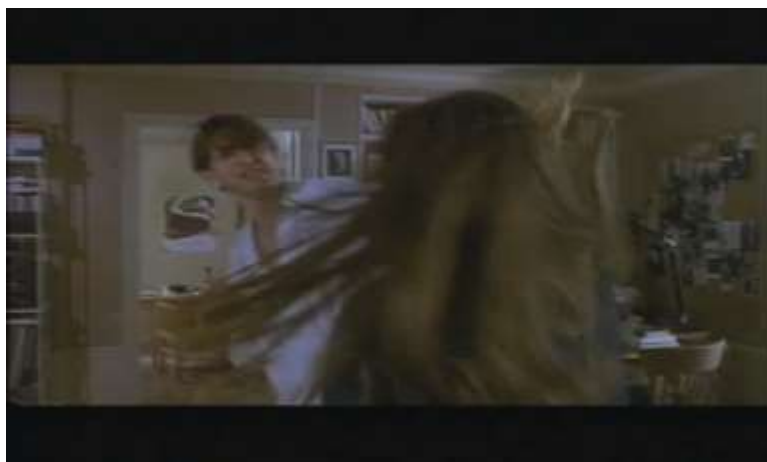
Fotograma, “Bitter Moon”(1992 )Dir. Roman Polanski , Minuto 1:11:06

En ese instante, ella le tira la botella de leche que estaba tomando, él la agarra del cabello y ella le pega repetidamente, así que él la toma por los brazos y la golpea fuertemente en la cara gritándole: ¡eres una maldita perra!, ella cae al suelo y queda inconsciente.