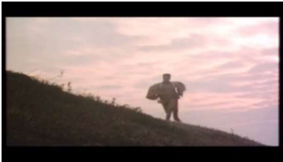
Fotograma “ Ai no Korida” (1976) Dir. Nagisa Oshima, Minuto 39:18

Otra de las escenas en donde entra en juego el imaginario de Sada, es cuando ésta decide ir a prestarle sus servicios sexuales a un intelectual para ganar dinero. Ella quien había dejado su Kimono a Kichizo en vez de el de él, para asegurarse de que no regresará a casa, mientras viaja en el tren, fantasea con el hecho de que este sale corriendo -sin importar que solo tenga su Kimono- para ir a su anterior casa, donde se encuentra su otra mujer.