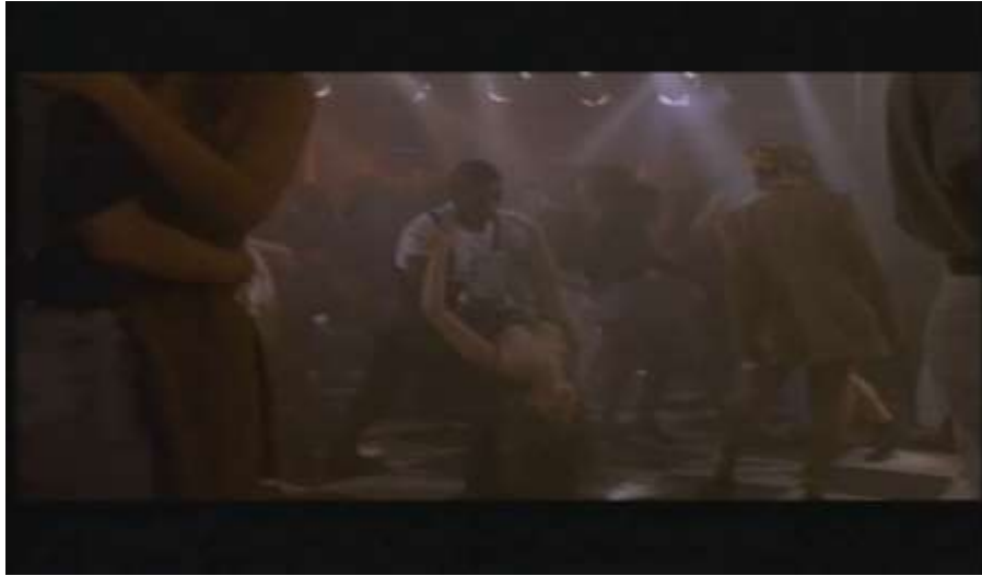
Fotograma, “Bitter Moon”(1992 )Dir. Roman Polanski , Minuto 48:24