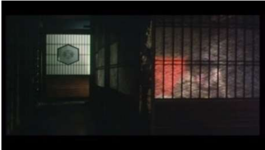
Fotograma “ Ai no Korida ” (1976) Dir. Nagisa Oshima, Minuto 43:52

tienen relaciones sexuales- escena que se ve detrás de una pared semi-transparente- ella le expresa que le ha hechado mucho de menos y que no lo volverá a dejar.