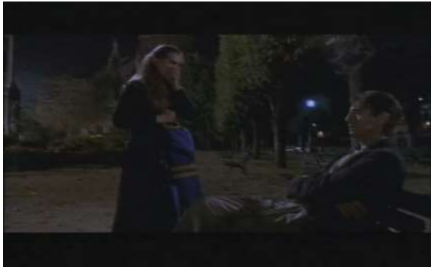
Fotograma, “Bitter Moon”(1992 )Dir. Roman Polanski , Minuto 1:15:28

Mimi solo se levanta desolada por lo que acaba de ocurrir y se va, incluso de la casa.