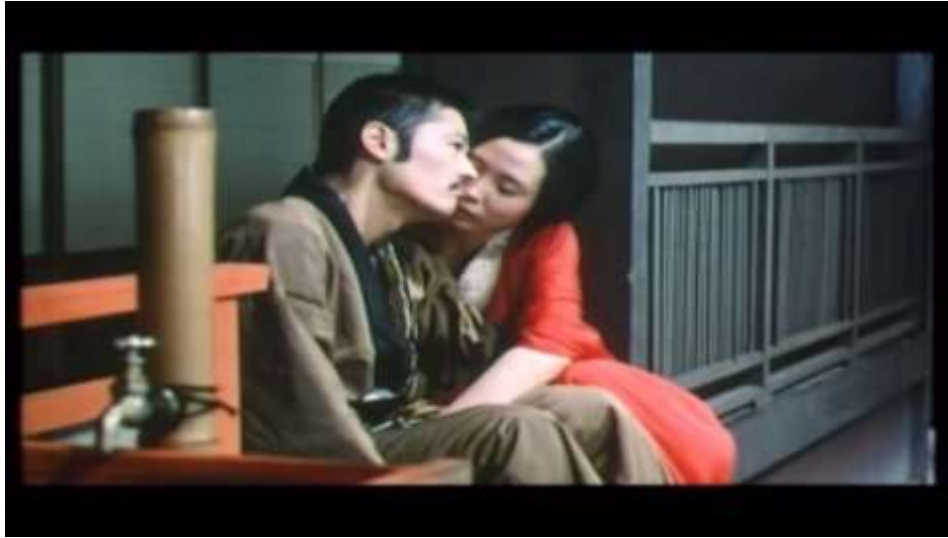
Fotograma “ Ai no Korida” (1976) Dir. Nagisa Oshima, Minuto 33:34