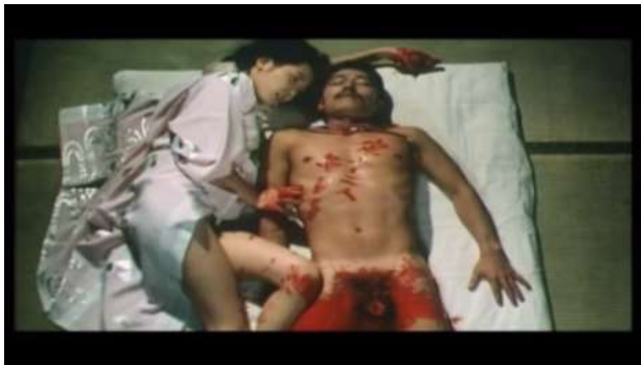
Fotograma “ Ai no Korida” (1976) Dir. Nagisa Oshima, Minuto 1:35:29

Luego con la sangre escribe en el cuerpo de Kichizo: “Kichi y Sada juntos, nada más que nosotros dos”