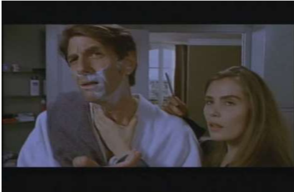
Fotograma, “Bitter Moon”(1992 )Dir. Roman Polanski , Minuto 32:47

expresión de desconfianza y Mimi se le observa con la barbera en la mano, mirando al espejo y sosteniendo el cuello de Oscar como en una posición de amenaza. Ella le lame la sangre del rostro a él y le sonrío de una forma siniestra.