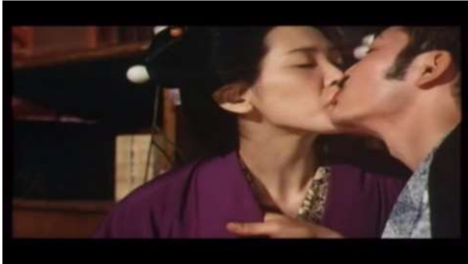
Fotograma “ Ai no Korida” (1976) Dir. Nagisa Oshima, Minuto 10:56

El la agarra del kimono la sujeta bien y pasa de su boca a la de ella un poco de sake para que lo tome, en ese mismo momento, e introduce su mano entre las piernas de Sada y comienza a cantar: