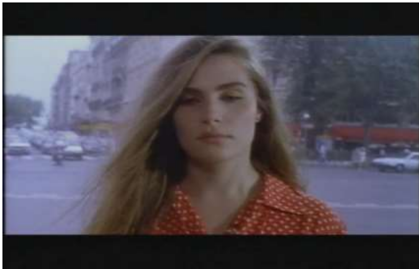
Fotograma, “Bitter Moon”(1992 )Dir. Roman Polanski , Minuto 11:13

“La eternidad para mí comenzó un día de otoño en París..., en el autobús 96 que iba de Montparnasse a Pte. Des Lilacs”