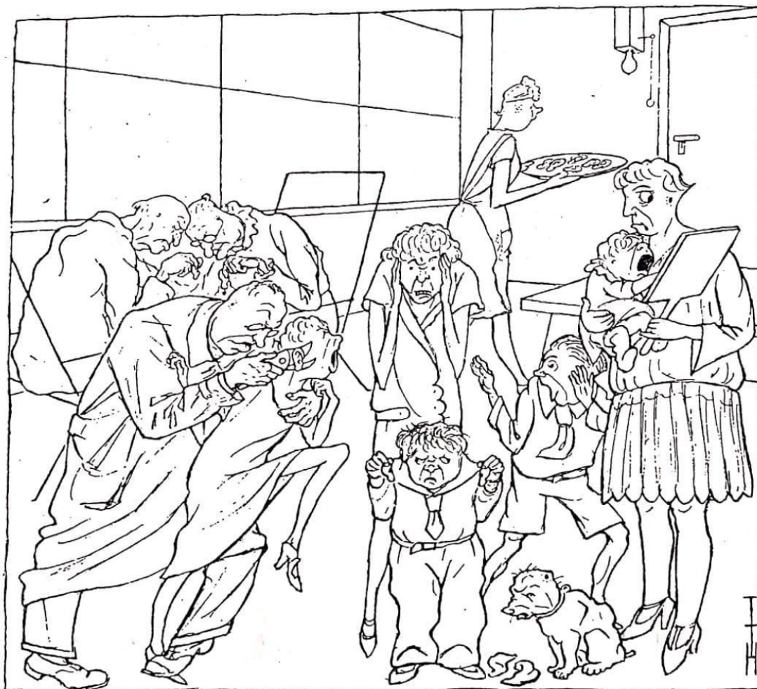
FIGURA REPRODUCIDA DE H. DAUCHER, «VISIÓN ARTÍSTICA Y VISIÓN RACIONALIZADA». Ed. GUSTAVO GILI, BARCELONA