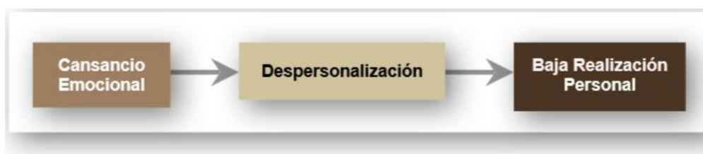
Figura 1 Fases de Leiter y Maslach (1988).