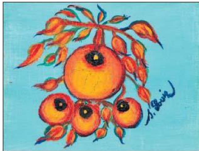
Les Grenades. (1920). Musée d'Art et d'Archéologie de Senlis, France

Desde 1912, Uhde empieza a comprar las pinturas, que va empujando a Seraphine, más allá de la suplencia, Uhde tiene un efecto desestabilizante, pues esta certeza empuja a Seraphine a tener que vérselas con el agujero. En el momento que deja de trabajar en casas, da rienda suelta a toda su creatividad y de la misma manera, a los fenómenos psicóticos.