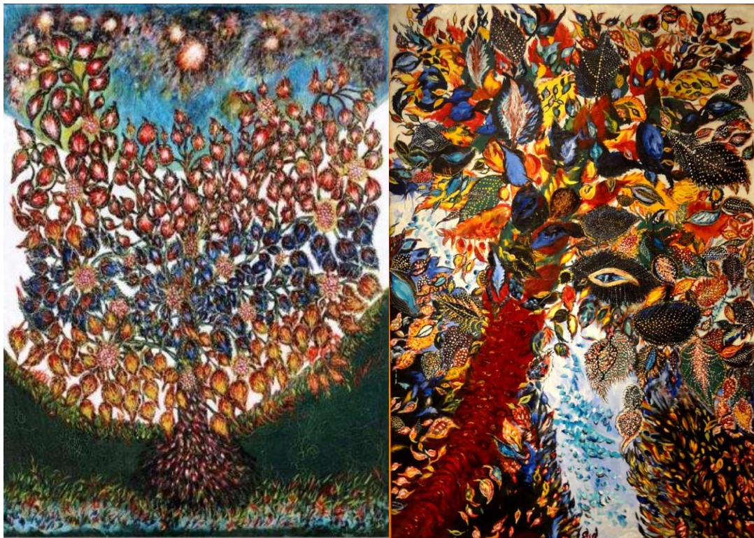
L'arbre de vie (1928)