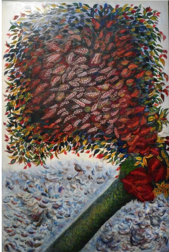
Le Arbre rouge (1928)

Musée national d'Art moderne - Centre Georges Pompidou, Paris (dominio público)