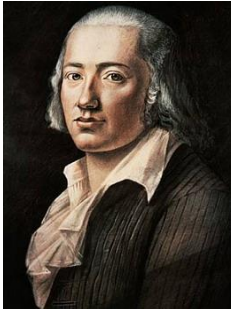
Pastell Von Franz Karl Hiemer, 1792 (dominio público)