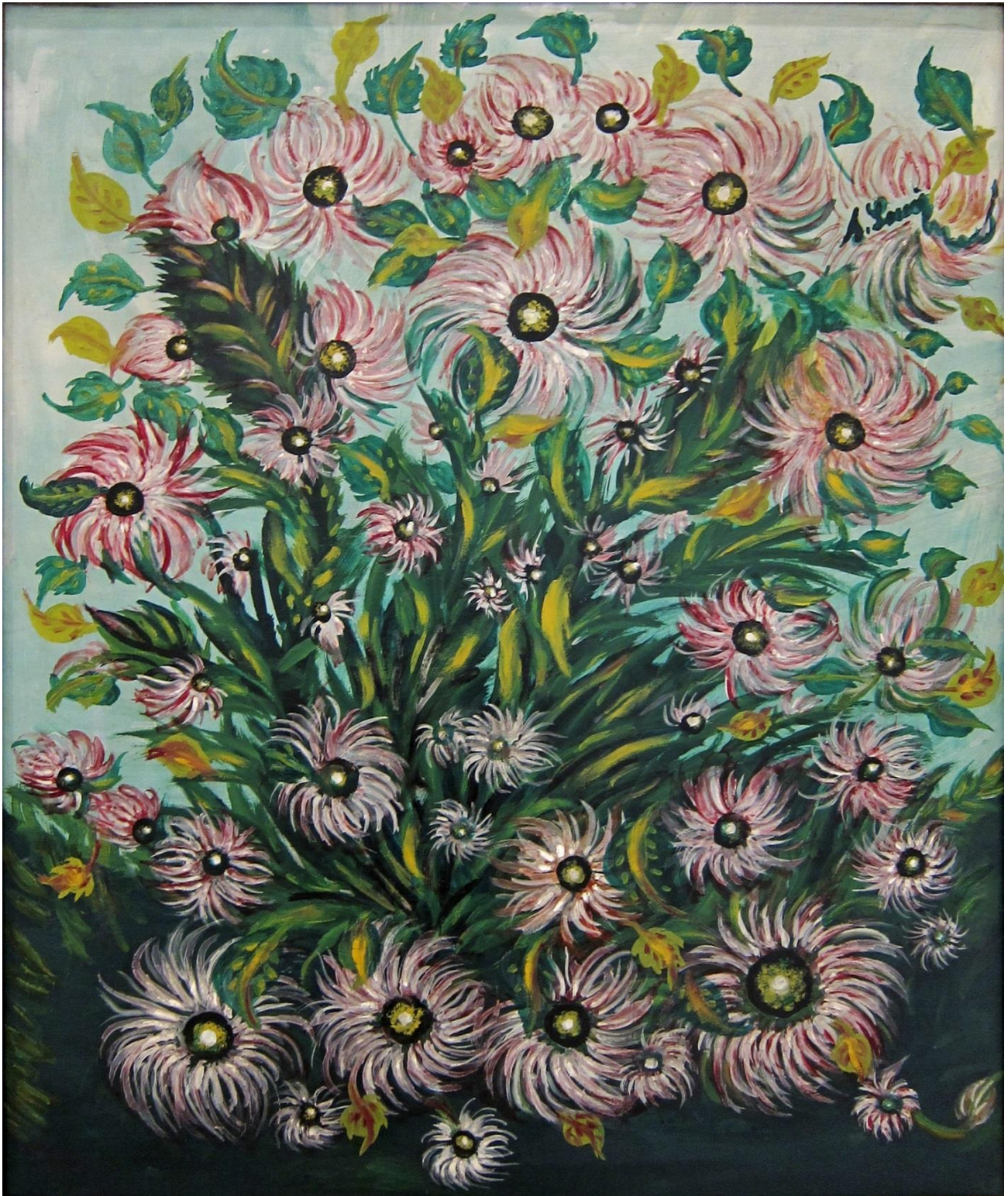
Bouquet de fleurs, Seraphine Louis. Musée d'art et d'archéologie de Senlis (domínio público)

“En la actualidad temo acabar sufriendo la suerte de Tántalo, que recibió de los dioses más de lo que podía digerir”. (Hölderlin, F. 1815)