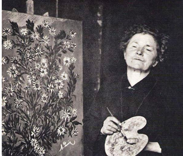
Fotografía de: Anne Marie, 1929 (Dominio público)