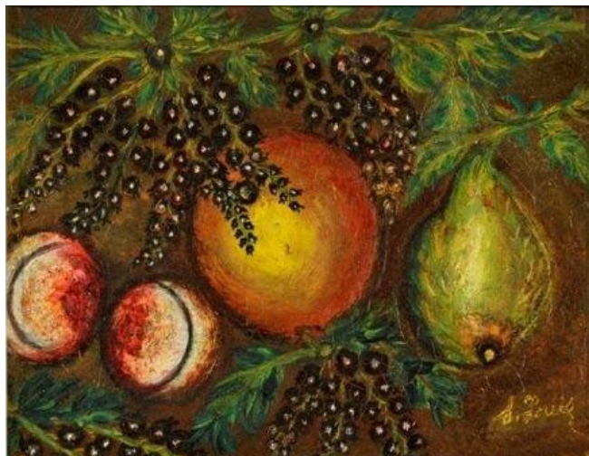
Cassis. (1918). Musée d'art et d'archéologie de Senlis. (Dominio público)

Sus obras atravesadas desde el inicio por la impresión de elementos naturales como flores, frutas, ramas. Plagados de color en cada pincelada, y de significados ocultos a la virgen.