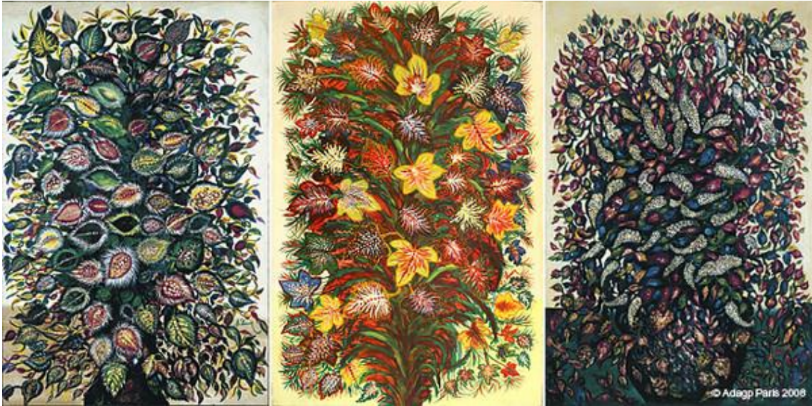
De izquierda a derecha. Feuilles (1920). Musée Maillol; Feuilles D'automne (1925). Musée Maillol; Fleurs et Fruits (1928). musée d'Art et d'Archéologie de Senlis (Dominio público)