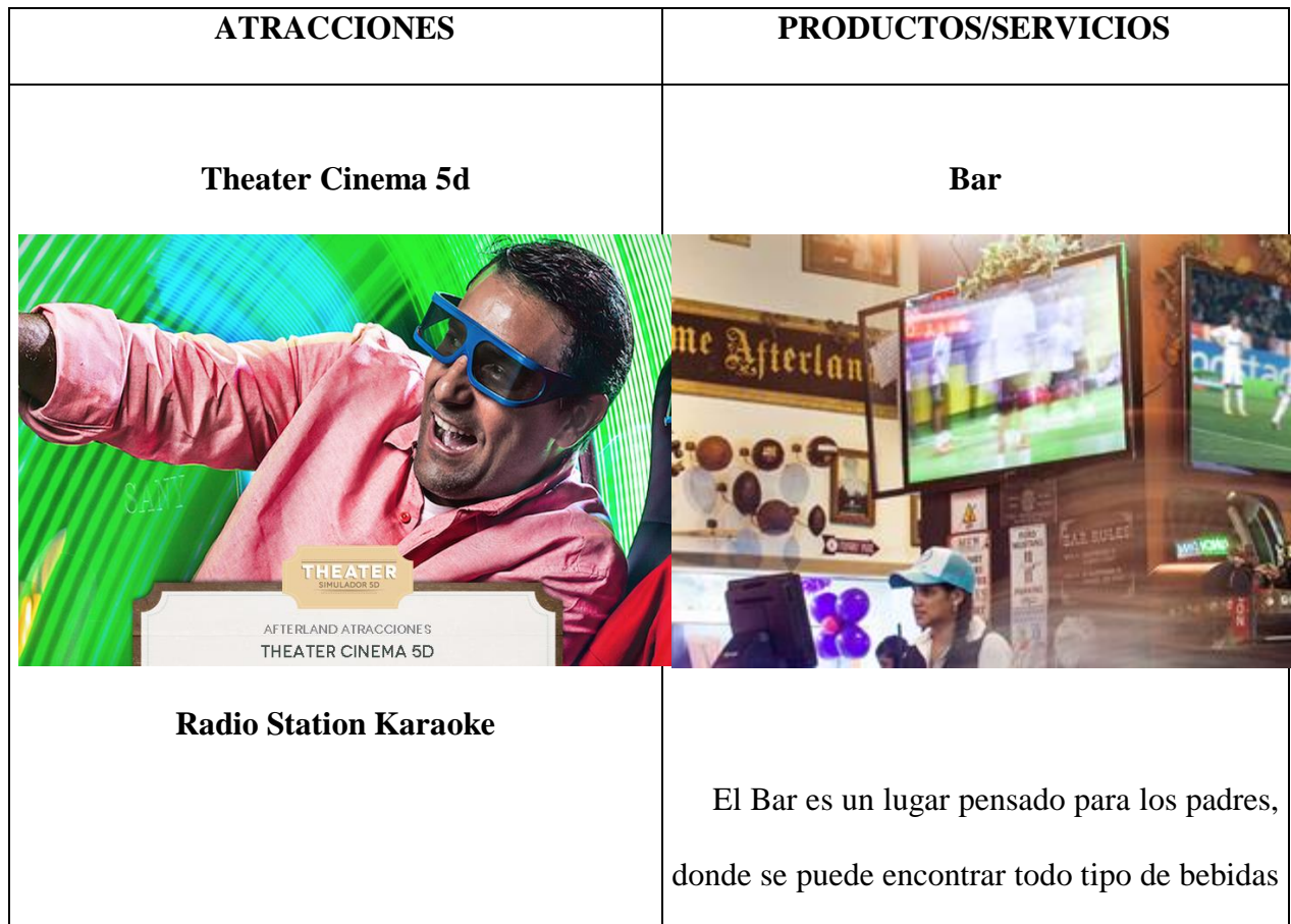
Ilustración 2: Productos y servicios

En la ilustración 2 podemos observar sus principales productos y servicios.