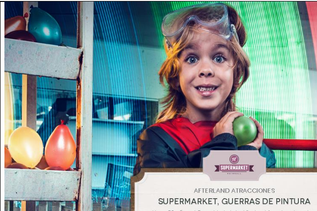
AFTERLAND ATRACCIONES SUPERMARKET, GUERRAS DE PINTURA