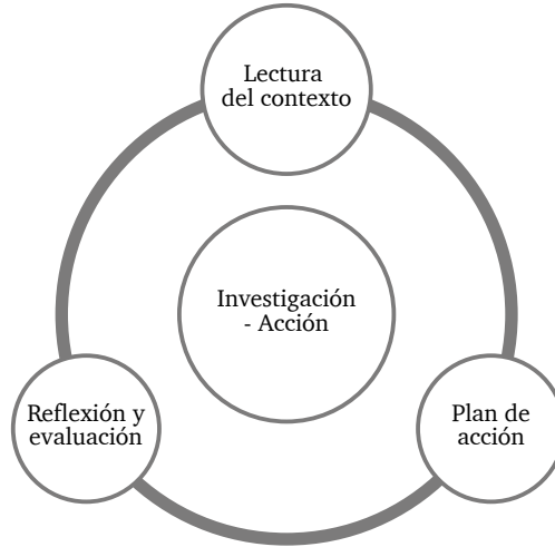
Figura 1. Proceso Investigación Acción: reconocimiento de la orientación sexual homosexual en un grupo de personas gay y lesbianas.