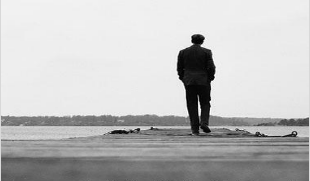
Fotografía: ¿Cómo Olvidar El Pasado? autor: Desconocido

Ella lo quiere olvidar, Se tomó el día para hacerlo, Él se tomó una foto para vivirlo.