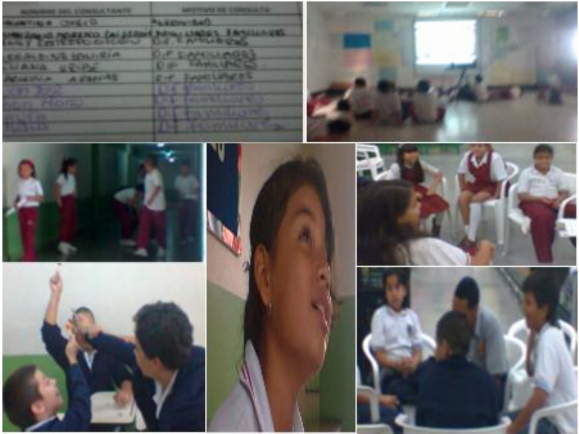
Mosaico n° 2 imágenes de actividades realizadas: Proyecto dos, etapa uno.