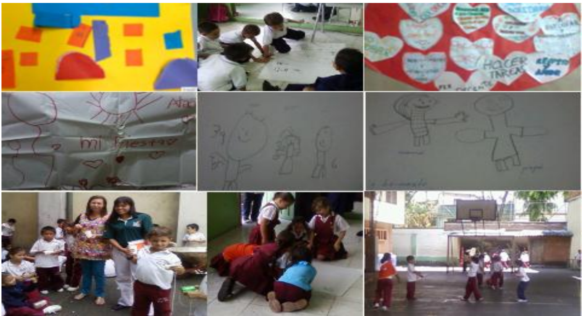
Mosaico n° 1 imágenes de actividades realizadas: Proyecto uno.

Se recomienda darle continuidad al trabajo desde la Escuela de Padres de la institución, de manera que se le suministren a los padres y/o cuidadores, elementos que conlleven a reforzar y/o modificar en positivo, sus pautas de crianza a la educación de sus hijos.