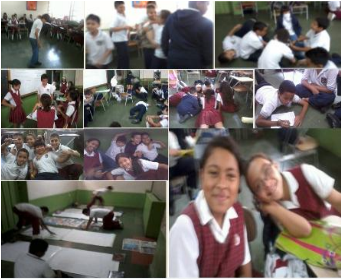
Mosaico n° 4 imágenes de actividades realizadas: Proyecto dos, etapa dos

Avances Significativos: Los avances visualizados hasta el momento, se consolidaron en el siguiente cuadro: