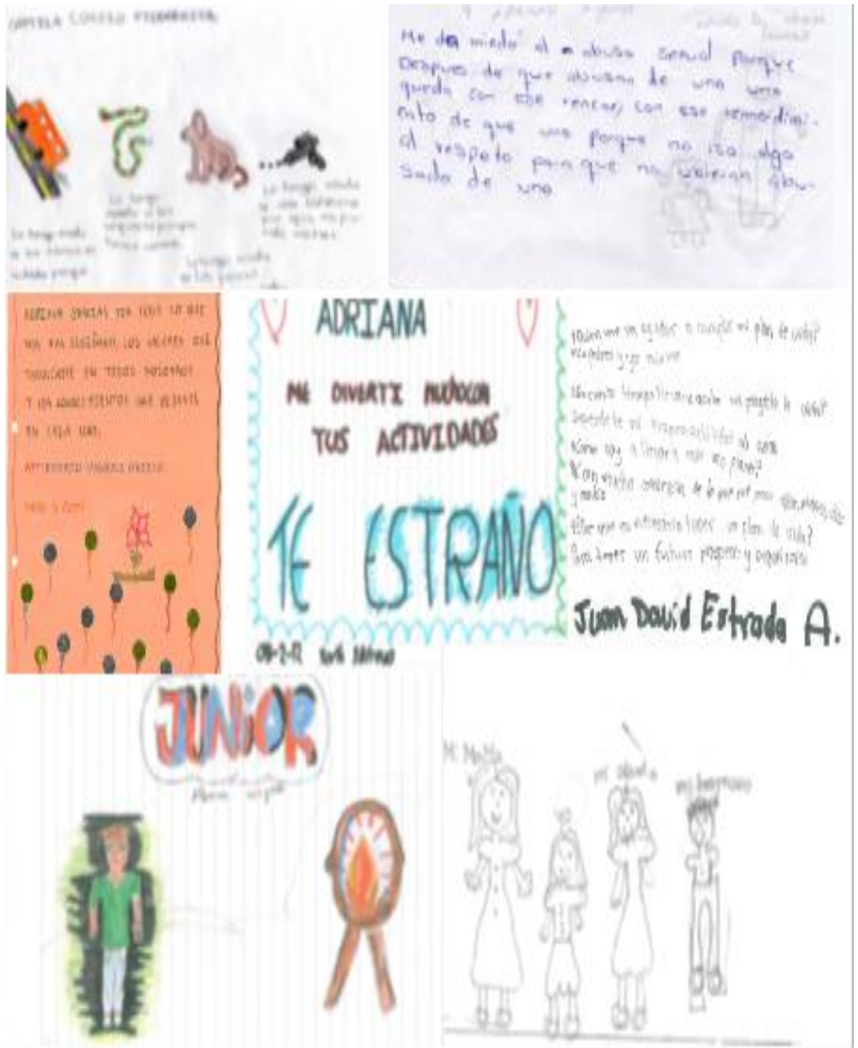
Mosaico n° 3 imágenes de actividades realizadas: Proyecto dos, etapa dos.