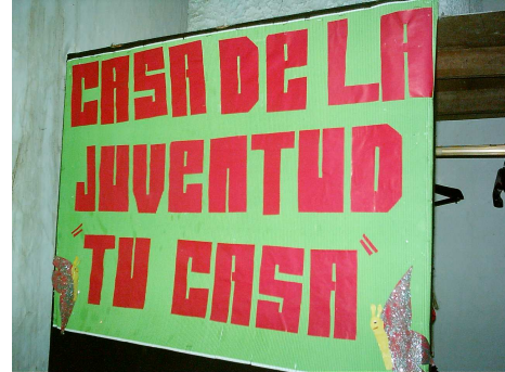
Espacios de la Casa de Juventud – Salón Danza