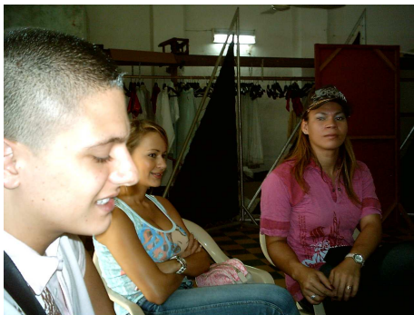
Equipo de Investigación con los líderes Juveniles