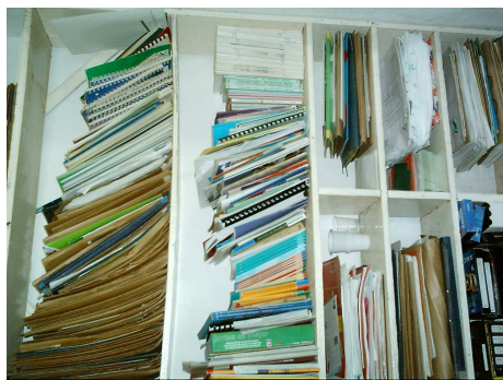
Esta es la biblioteca juvenil