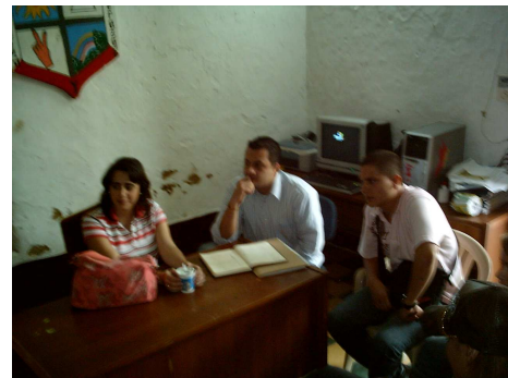
Equipo de Investigación con los líderes Juveniles