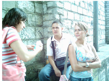
Ex coordinadora de juventud con el equipo investigación