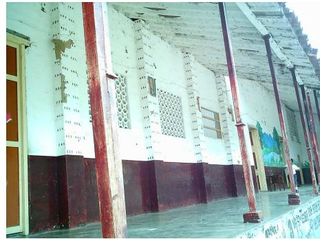
Espacios de la Casa de Juventud