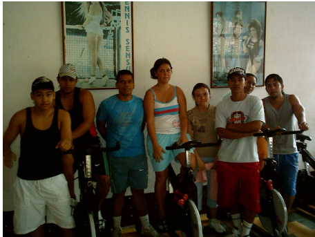
Espacios de la Casa de Juventud - Gimnasio