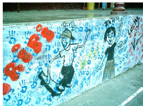
Espacios de la Casa de Juventud