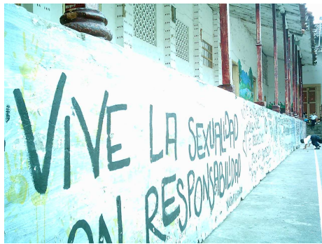
Espacios de la Casa de Juventud