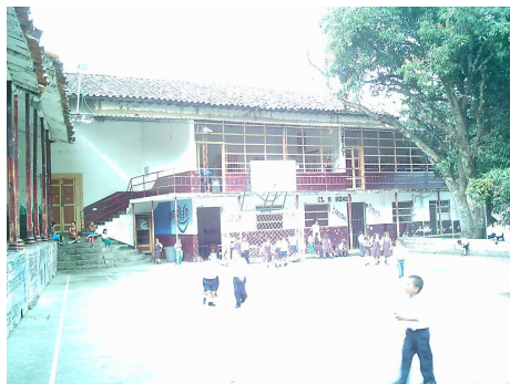
Espacios de la Casa de Juventud – Placa deportiva