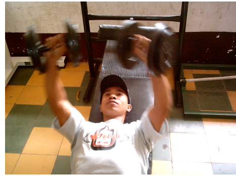
Espacios de la Casa de Juventud - Gimnasio