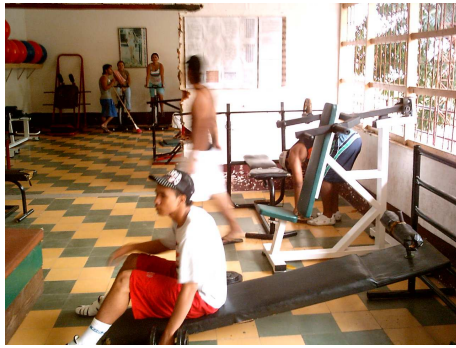
Espacios de la Casa de Juventud - Gimnasio