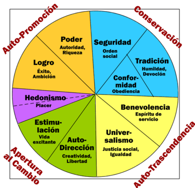
Gráfica 1: Los valores y su clasificación por categorías

Los valores de conformidad y tradición están ubicados en el grupo de la conservación y estos están opuestos a la apertura al cambio ya que la estimulación y creatividad que están ubicadas allí apuntan más al concepto subjetivo y los valores del grupo de la conservación están apuntando a un objetivo más ligado al orden social y a la norma preestablecida por la sociedad, como su mismo nombre lo indica es muy objetivo y el otro grupo es muy subjetivo, los otros dos grupos el de la auto-trascendencia y la auto-promoción se oponen ya que el primer grupo denota la preocupación por los intereses y bienestar de los demás y el grupo opuesto de la auto-promoción busca el interés propio, el éxito y el dominio sobre los demás, aparte se encuentra el valor del hedonismo y se relaciona con el grupo de apertura al cambio y la auto-promoción.