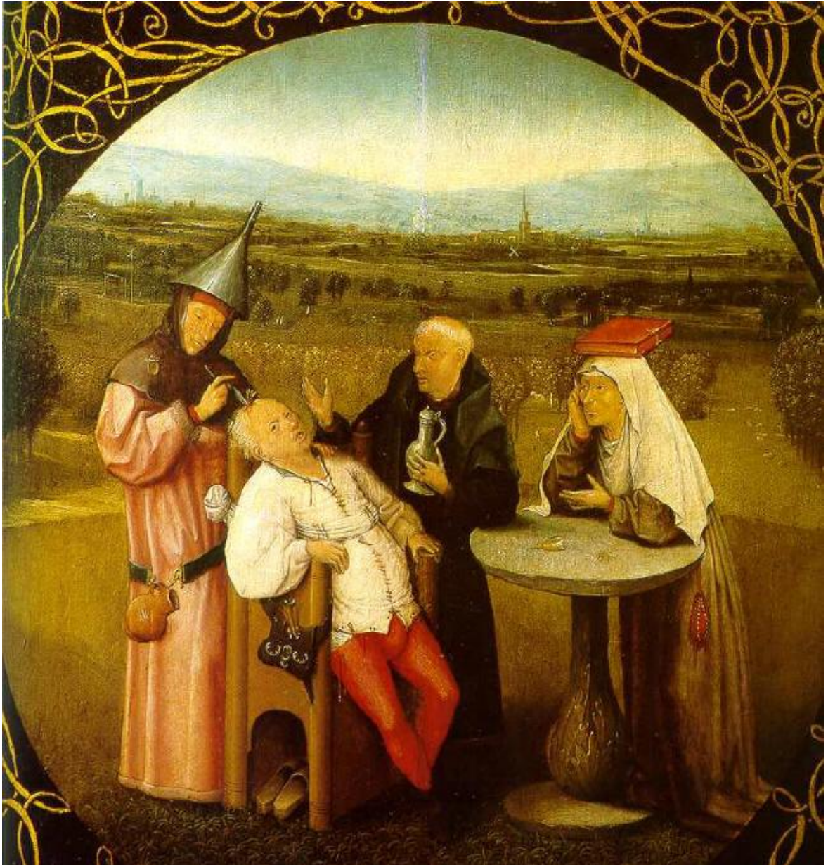
La piedra de la locura (1490), Hieronymus Bosch