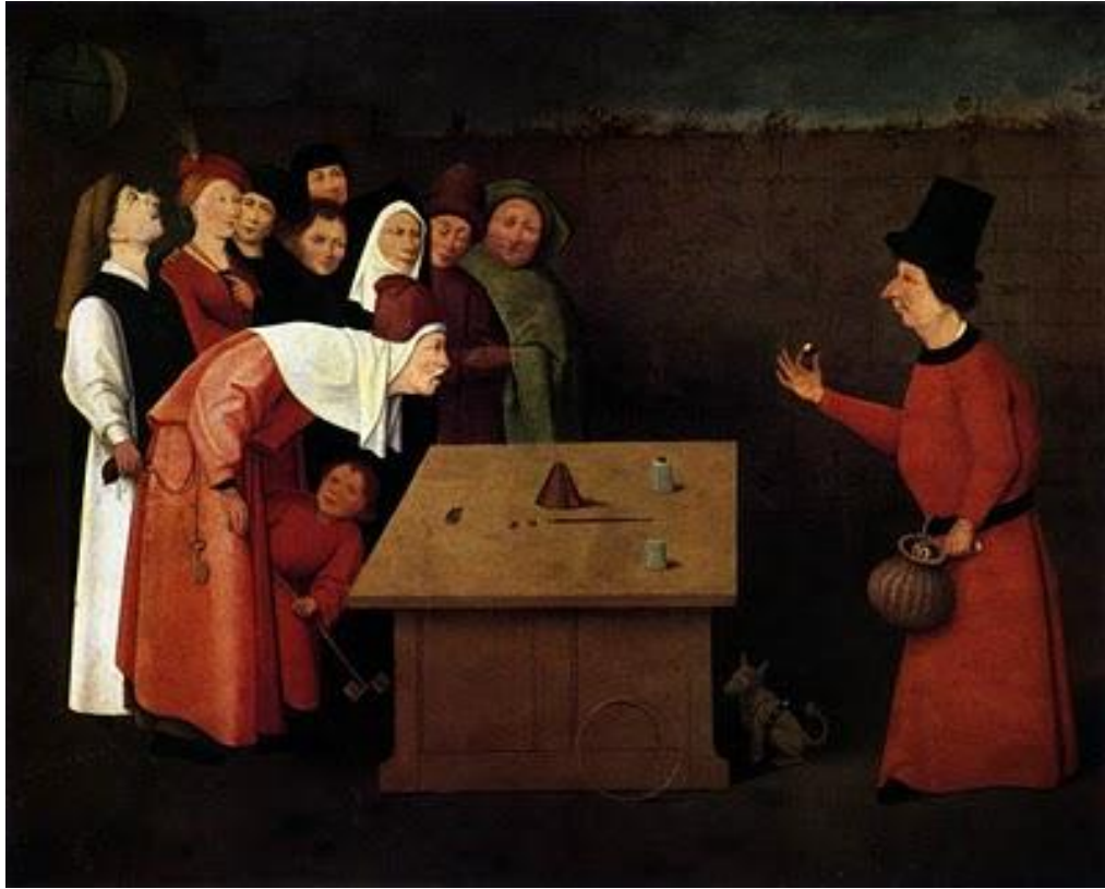
El prestidigitador, El Bosco 1502

Óleo sobre tabla 53 x 65 cm (Museo Municipal de Saint Germain en Laye – Francia)