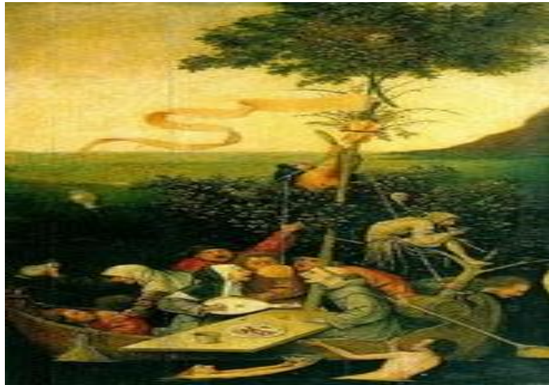
La barca de los locos, Hieronymus Bosch

Y serán las ciencias humanas, propias de la modernidad, las que pasaran a nombrar al hombre como sujeto, vía los procesos de objetivación, en tanto que sujeto productivo: estatuto de ciencias que pretenden a través de prácticas de ruptura, separar al sujeto de sí mismo y del otro. Las ciencias, nos indica Foucault (1991), dan lugar a un proceso múltiple de técnicas que objetivizan y clasifican, “como ejemplo se encuentra el loco y el cuerdo, el enfermo y el sano, los criminales y los muchachos buenos” (p.52). Se pasa del hombre al sujeto, enmarcado éste en una amplia red de relaciones, tanto de producción como de significación. Todas estas técnicas de sujeción permiten la formación de un nuevo objeto: el cuerpo natural, el cual se establece como portador de fuerzas y sede de una duración. En este sentido, el cuerpo como blanco de nuevos mecanismos de poder, se ofrece a nuevas formas de saber. Pero el cuerpo al que se busca manipular y encauzar, muestra como oposición las condiciones de funcionamiento propias de un organismo. Es así como, el poder disciplinario no sólo debe ocuparse de una individualidad analítica y “celular” sino natural y “orgánica” en tanto nuevo objeto de saber. (Foucault, 1973).